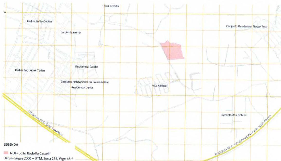
Figura 1 - Croqui de localização do loteamento João Rodolfo Castelli