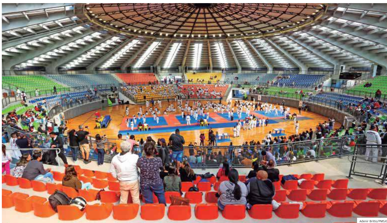
Evento. Tradicional exame para troca de faixas do taekwondo emocionou e uniu famílias em evento no Teatrão, na Vila Industrial

Além de ser a nova casa do Atleta Cidadão, o complexo pode também ser utilizado em jogos e treinos das equipes de alto rendimento.