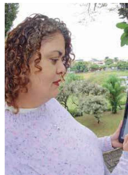
Verde. Árvores de São José bem cuidadas