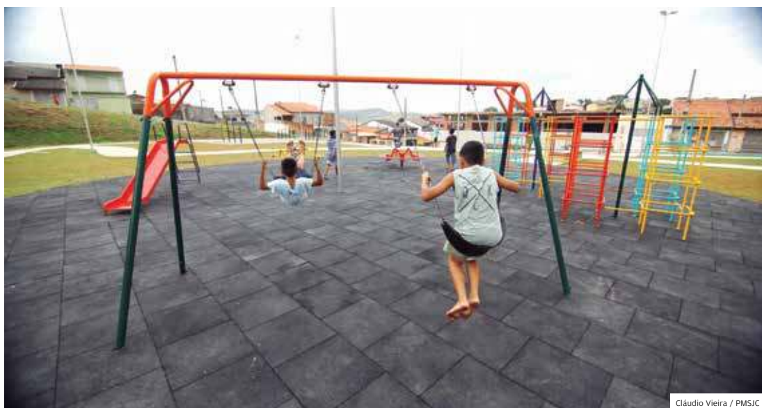
Sudeste. No Jardim Santo Onofre, infraestrutura e segurança para proporcionar lazer para crianças