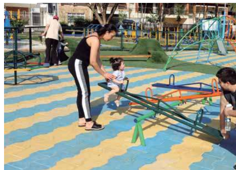
Kids. Playground interativo na Praça Floripes Bicudo Martins, região centr