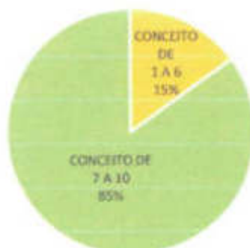
Gráfico 4. Percentual de conceitos de visita técnica dos itens relacionados ao quadro "Limpeza e Conservação".