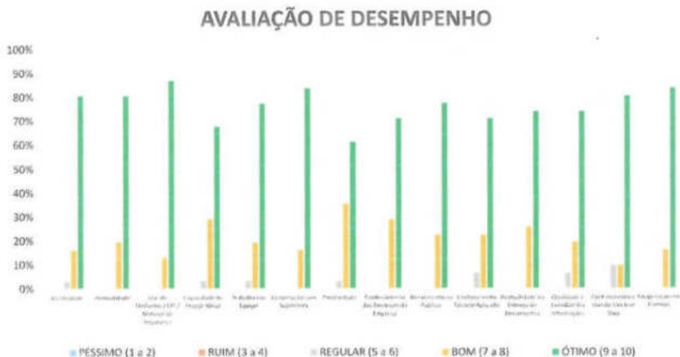
Gráfico 2. Avaliação de desempenho da Equipe Administrativa.

No que diz respeito aos itens avaliados e tabulados da avaliação de desempenho dos Auxiliares de Serviços Gerais (Gráfico 1), somados os conceitos bom e ótimo, o menor percentual alcançado foi 85,9% (item Proatividade), já o maior percentual alcançado, nos mesmos conceitos, foi 93,9% (itens Assiduidade, Pontualidade e Uso de Uniforme/EPI/Material de Segurança).