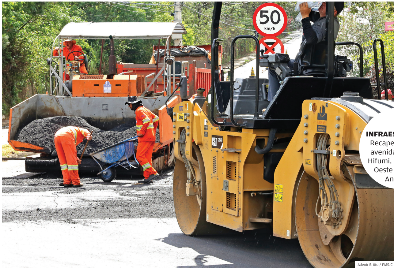
INFRAESTRUTURA. Recapeamento na avenida Shishima Hifumi, obra da Via Oeste e ação na Anchieta