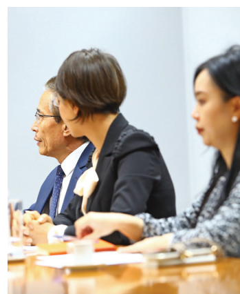
Negócios. Executivos asiáticos

ECONOMIA. Executivos da empresa AIDC (Corporação de Desenvolvimento Industrial Aeroespacial) de Taiwan e dirigentes do Escritório Econômico e Cultural de Taipei foram recebidos em audiência no Paço em janeiro. A visita faz parte de um conjunto de iniciativas que buscam parcerias e novos negócios.