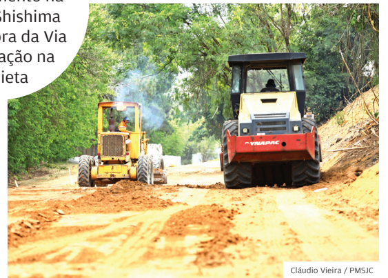
Cláudio Vieira / PMSJC