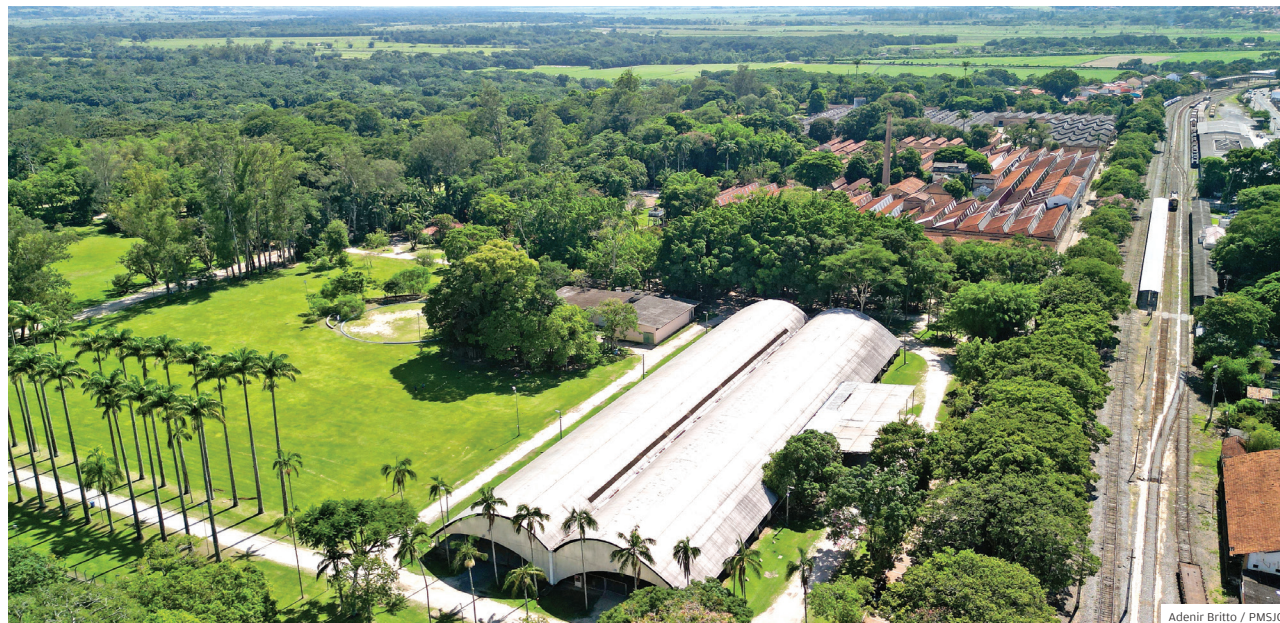
Atração. Projeto prevê centro equestre, mall, teatro, museu Olivo Gomes e Burle Marx, Casa do Lago e roda gigante

ATRAÇÕES PROJETO TAMBÉM PREVÊ TRILHAS E PASSARELAS ELEVADAS, TELEFÉRICO, CENTRO DE CONVENÇÕES E MUITO MAIS