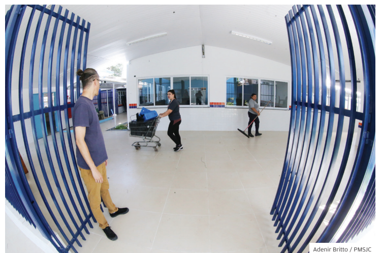
Adenir Britto / PMSJC

Na região oeste, Prefeitura de São José dos Campos realiza a terceira etapa da Via Oeste, que inclui a terraplanagem, drenagem, pavimentação asfáltica em um trecho de 3,6 quilômetros. Também fez o recapeamento da avenida Shishima Hifumi e ruas do entorno.