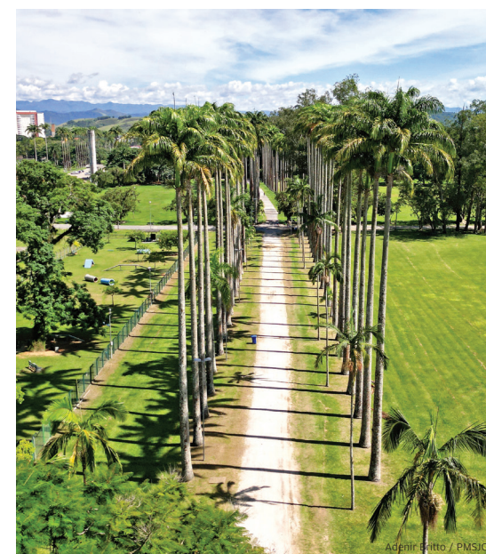
Verde. Palmeiras imperiais na entrada do parque