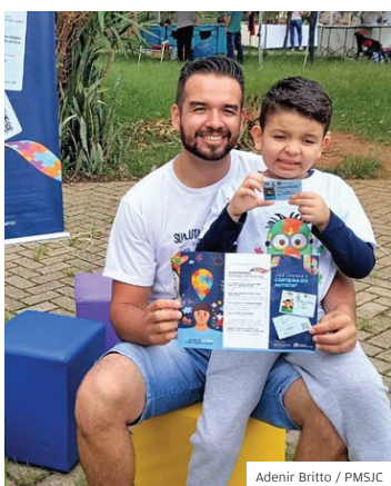
Adenir Britto / PMSJC

INCLUSÃO. No ano passado, a Prefeitura emitiu 682 documentos da carteira de identificação da pessoa com TEA (transtorno do espectro autista), um avanço na inclusão social. Desde o início da ação, em 2021, são 1.593 pessoas com o transtorno que possuem a carteirinha. A iniciativa foi lançada com base na Lei Federal 13.977/2020.