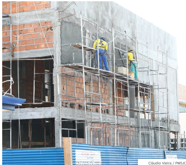
Cláudio Vieira / PMSJC