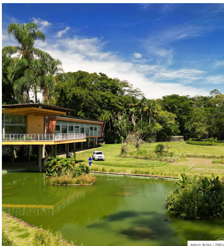
Estrutura. Residência Olivo Gomes preservada pela Prefeitura

A Prefeitura apresentou a proposta de concessão do Parque Roberto Burle Marx, o Parque da Cidade. A proposta prevê investimento privado de R$181 milhões. A concessão será de 25 anos. O Estado deve repassar R$100 milhões, além dos R$12 milhões já liberados para reforma do telhado da Fundação Cultural. A Prefeitura ainda deve investir R$79 milhões na obra do complexo da avenida Sebastião Gualberto. O vencedor do edital poderá construir centro equestre, restaurante, mall, teatro, museu Olivo Gomes e Burle Marx, Casa do Lago, roda gigante, trilhas e passarelas elevadas, teleférico, trilha para caminhada, uso do rio Paraíba e Centro de Convenções.