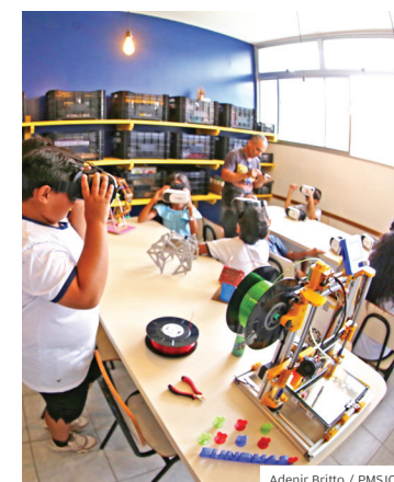
Social. Fundhas Alto da Ponte foi totalmente reformada em janeiro deste ano