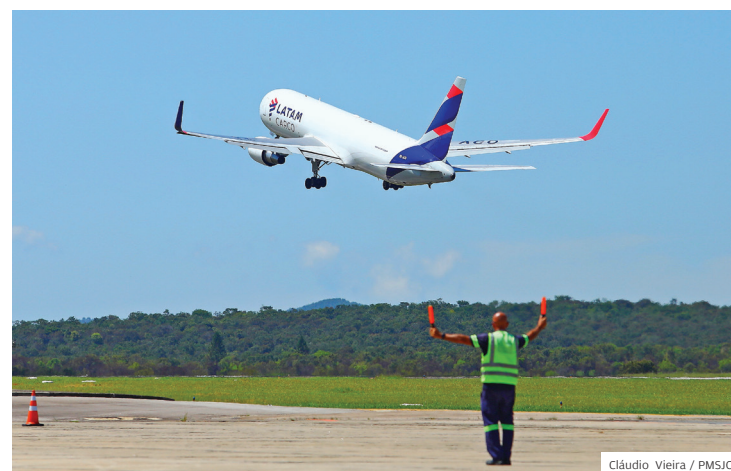
Cláudio Vieira / PMSJC