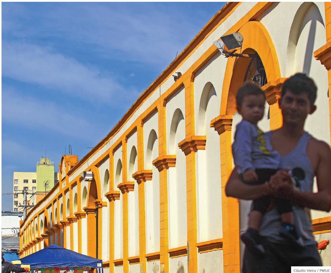
Cláudio Vieira / PMSJC