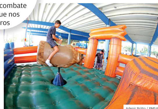
Adenir Britto / PMSJC

BEM-ESTAR. Programas garantem qualidade de vida; São José reforçou combate à dengue nos bairros