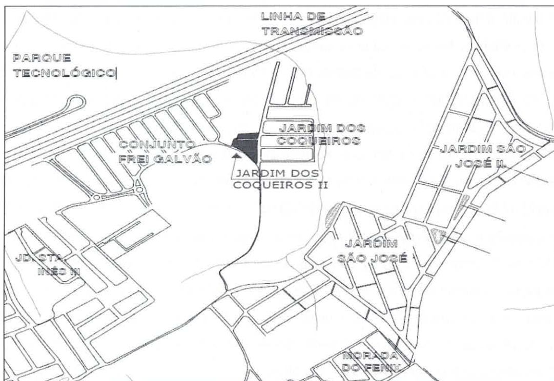
Croqui de localização do loteamento Jardim dos Coqueiros II

Secretário de Gestão Habitacional e Obras