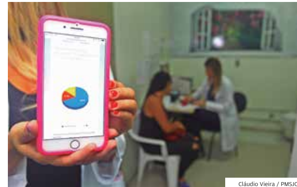
Cláudio Vieira / PMSJC

Atendimento. Funcionária arruma aparelho do HM