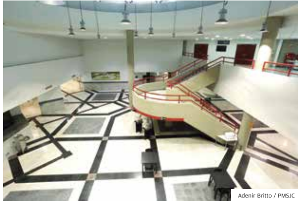
Adenir Britto / PMSJC

TECNOLOGIA O 5G É A QUINTA GERAÇÃO DE INTERNET MÓVEL E ESTÁ EM IMPLANTAÇÃO