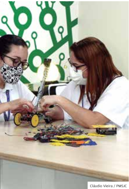
Cláudio Vieira / PMSJC