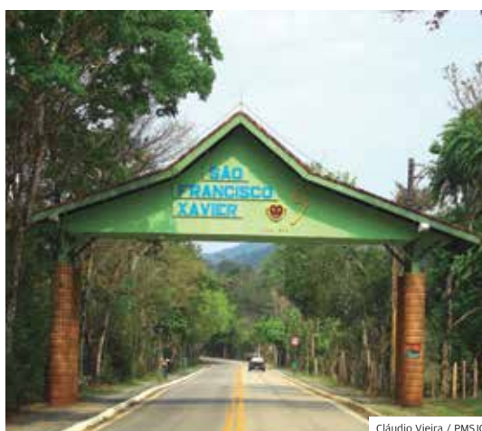
Pedal. Distrito terá percurso seguro para ciclistas

Está em fase final a revisão e atualização da Lei da Calçada Segura. Entre as principais mudanças estão a adequação da largura da faixa livre de circulação e do dimensiona-