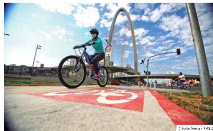
Modal. Durante a pandemia, o número de ciclistas aumentou

Serão implantadas com o objetivo de tornar os trajetos mais acessíveis para todos os cidadãos