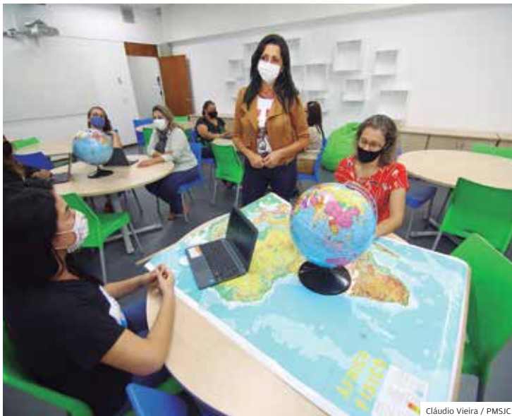
Cláudio Vieira / PMSJC