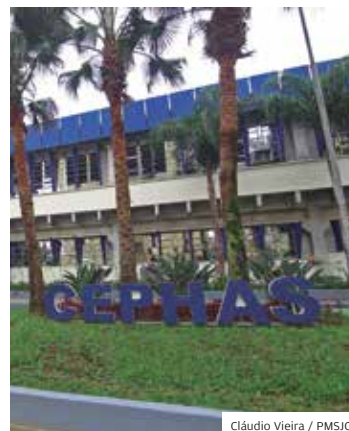
Cláudio Vieira / PMSJC

ESPORTE. As escolas municipais de São José retomaram as atividades do programa Escola Ativa, que oferece mais de 1.100 vagas em cinco modalidades esportivas. Os alunos inscritos podem participar de turmas de futsal, vôlei, judô, basquete e handebol em 13 escolas. O programa Escola Ativa oferece atividades no contraturno escolar.