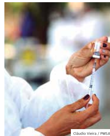
Cláudio Vieira / PMSJC

POSITIVO. São José atingiu em 29 de setembro a marca de 1 milhão de doses aplicadas em públicos acima de 12 anos, com ou sem comorbidades, da 1ª até a 3ª dose. Mais de 70% da população apta a receber vacinas contra a covid já foi completamente imunizada com duas doses ou dose única. O índice é referência de boa cobertura vacinal.