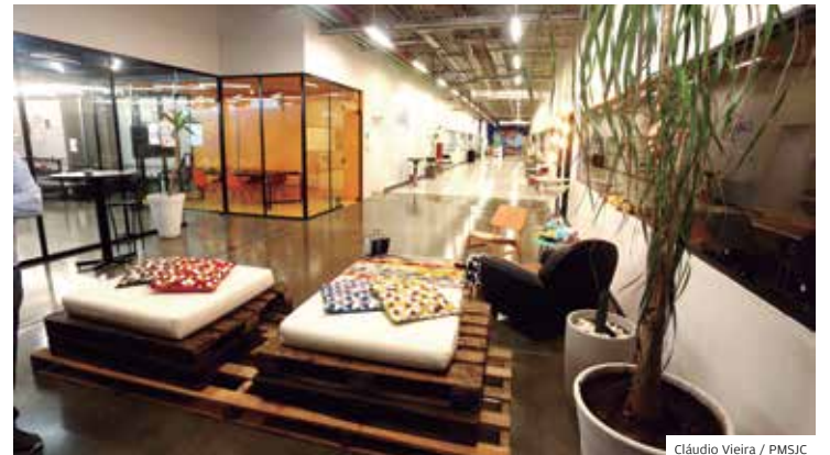
Cláudio Vieira / PMSJC

Já a Embratel realizará a integração das tecnologias desenvolvidas, ofertará as soluções para levar evolução digital aos segmentos da economia determinados e atuará na avaliação e atração de novas parcerias estratégicas.