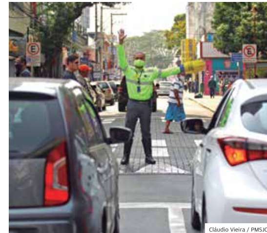
Ações. Semana do Trânsito teve atividades