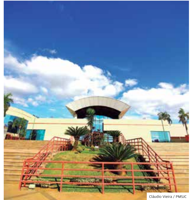
Cláudio Vieira / PMSJC

Tec. Criado em 2006, Parque é projeto da Prefeitura