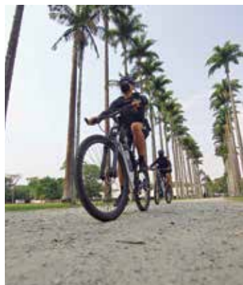
Ação. GCM no Parque da Cidade

BIKE. Com o objetivo de se aproximar ainda mais da comunidade, agora a Guarda Civil Municipal também conta com patrulhamento de bicicletas. Após a nova modalidade lançada neste ano ter sido intensificada na região central e nos bairros, chegou a vez dos parques. Além de zelarem pelo lazer seguro, os guardas dão orientações.