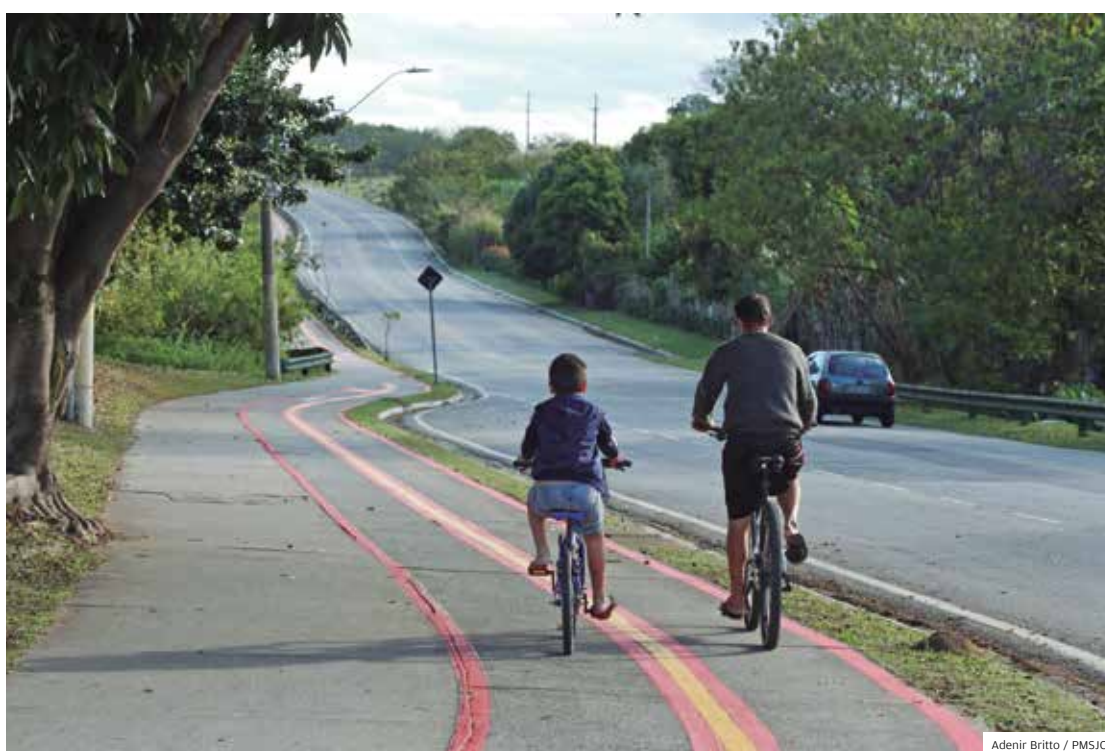
Malha. No início de 2017, eram 79 quilômetros de ciclovia. Agora, são mais de 150 quilômetros

mento dos passeios em novos loteamentos, a inserção e adequação e padronização para o conceito "espaço árvore" que deve ser adotado na área de serviço do passeio.