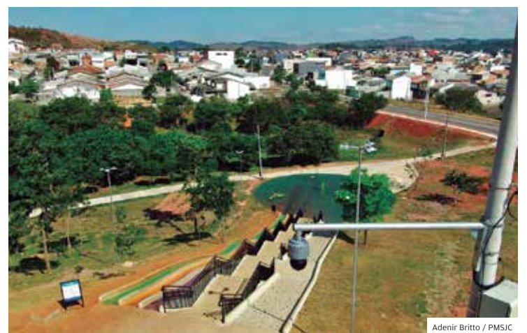
Adenir Britto / PMSJC

Visual. Ciclistas curtem paisagem no mirante construído no parque