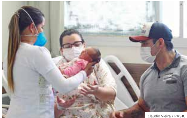
Cláudio Vieira / PMSJC

INFORMAÇÃO SISTEMA INFORMATIZADO AINDA VAI AUXILIAR NO GERENCIAMENTO DOS PROCESSOS DE ENTRADA NO HOSPITAL MUNICIPAL