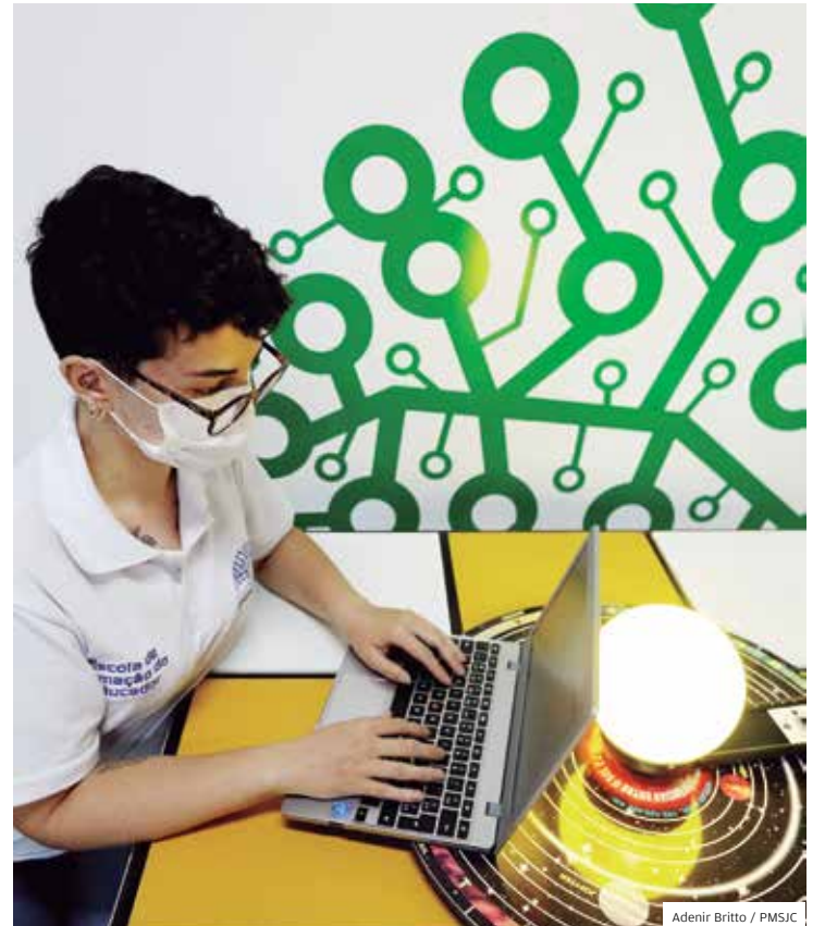
Adenir Brito / PMSJC