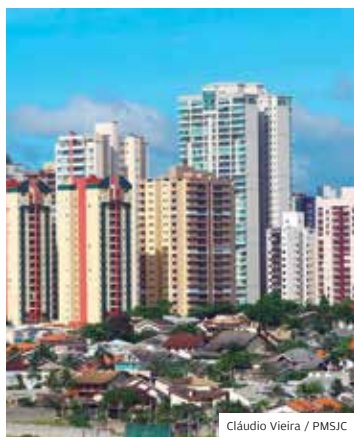
Cláudio Vieira / PMSJC

ALTA. A Prefeitura tem registrado números recordes de novos empreendimentos. O município prevê encerrar o ano com a aprovação de 4 novos loteamentos. No total, 66 processos de loteamentos estão sob os cuidados da Prefeitura. O número de processos aprovados chegou a 365 em julho deste ano contra 259 registrados em julho de 2020.