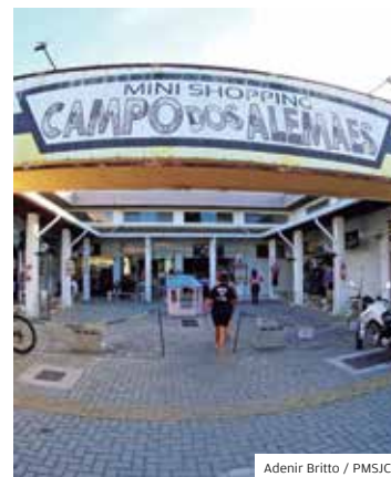
Adenir Britto / PMSJC

SUCESSO. O programa Galerias do Empreendedor, da Prefeitura de São José, está entre os 10 projetos finalistas de soluções inovadoras para o mercado. O prêmio "Inspiring Solutions" é organizado pela Associação Internacional de Parques Científicos e Tecnológicos e Áreas de Inovação e avalia o impacto de projetos inovadores.