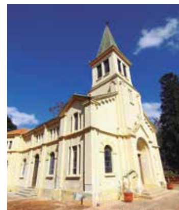
Fé. Capela no Vicentina Aranha

PLANO. Em mais uma ação inédita, São José terá, ainda neste ano, Plano de Contingência de atendimento em situações de emergência com o objetivo de garantir mais segurança à população e preservar vidas em casos envolvendo desastres naturais. O Plano será apresentado em audiência pública no dia 4 de outubro, às 18h, na Câmara.