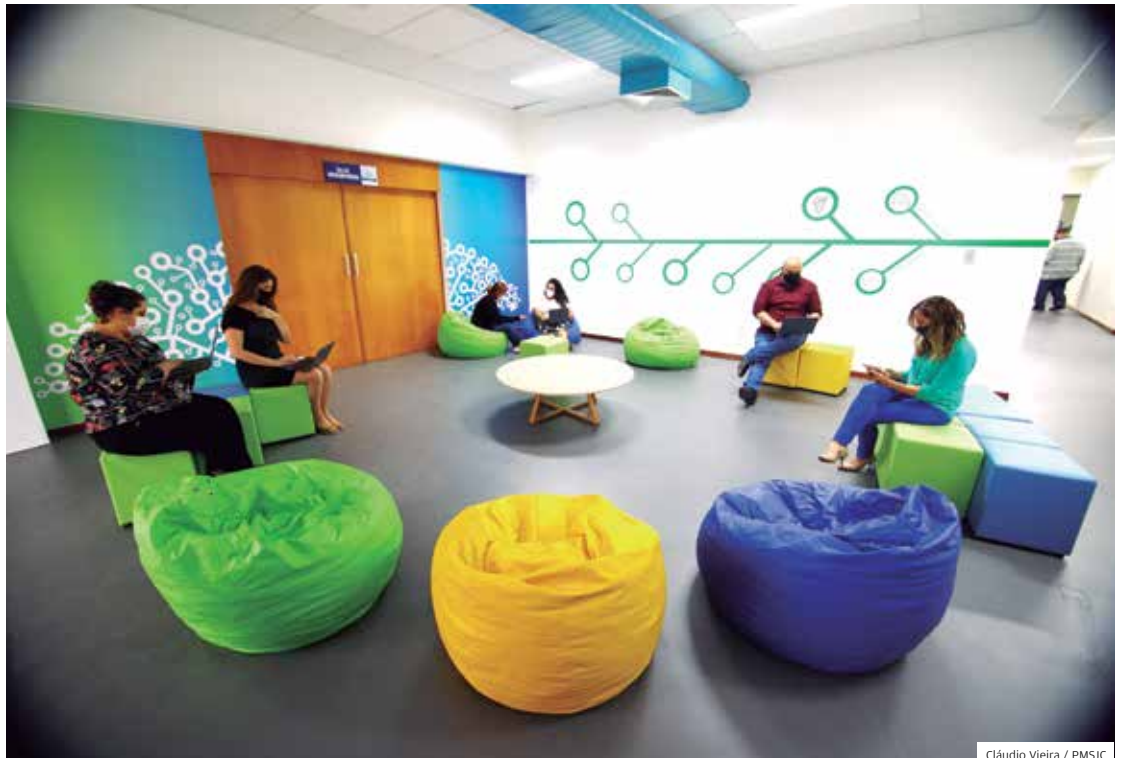
Cláudio Vieira / PMSJC

Em parceria com a Unesp (Universidade Estadual Paulista), a Prefeitura irá oferecer uma Pós Graduação (lato sensu) em Educação 5.0, ensino híbrido e metodologias ativas para mais de 2.600 professores efetivos. O curso tem duração de 24 meses e será realizado durante os HTC's.