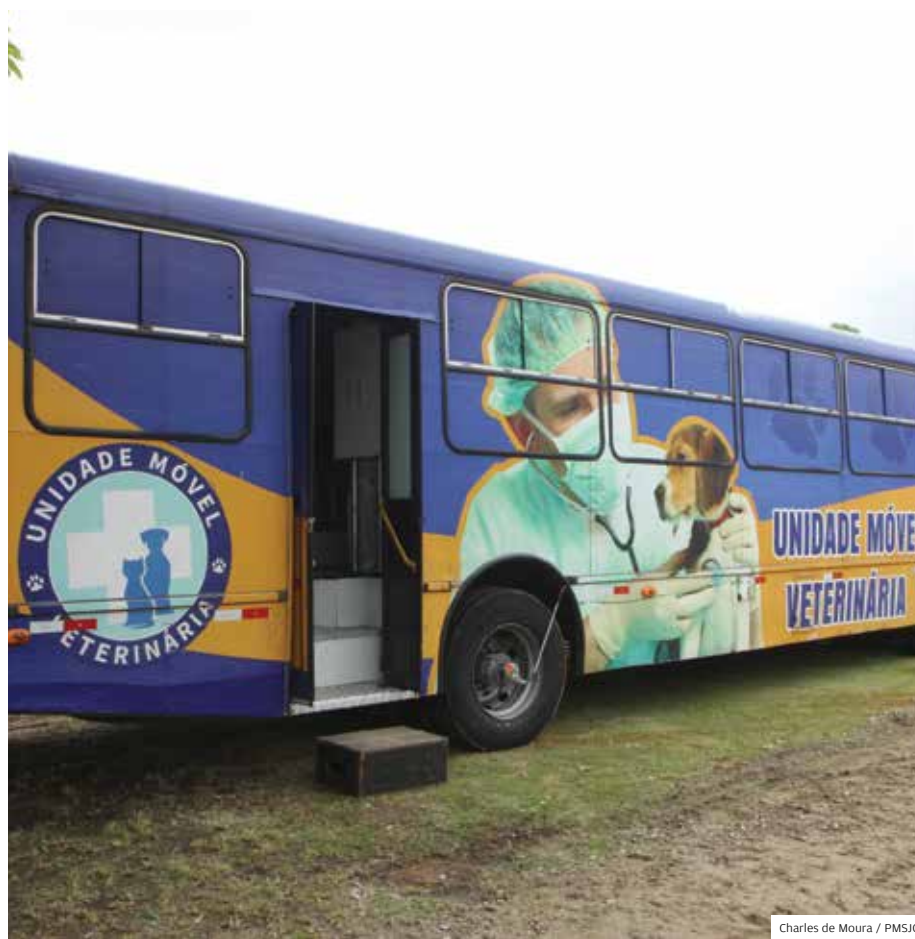
Charles de Moura / PMSJC

Saúde. Ônibus possui equipamentos de ponta