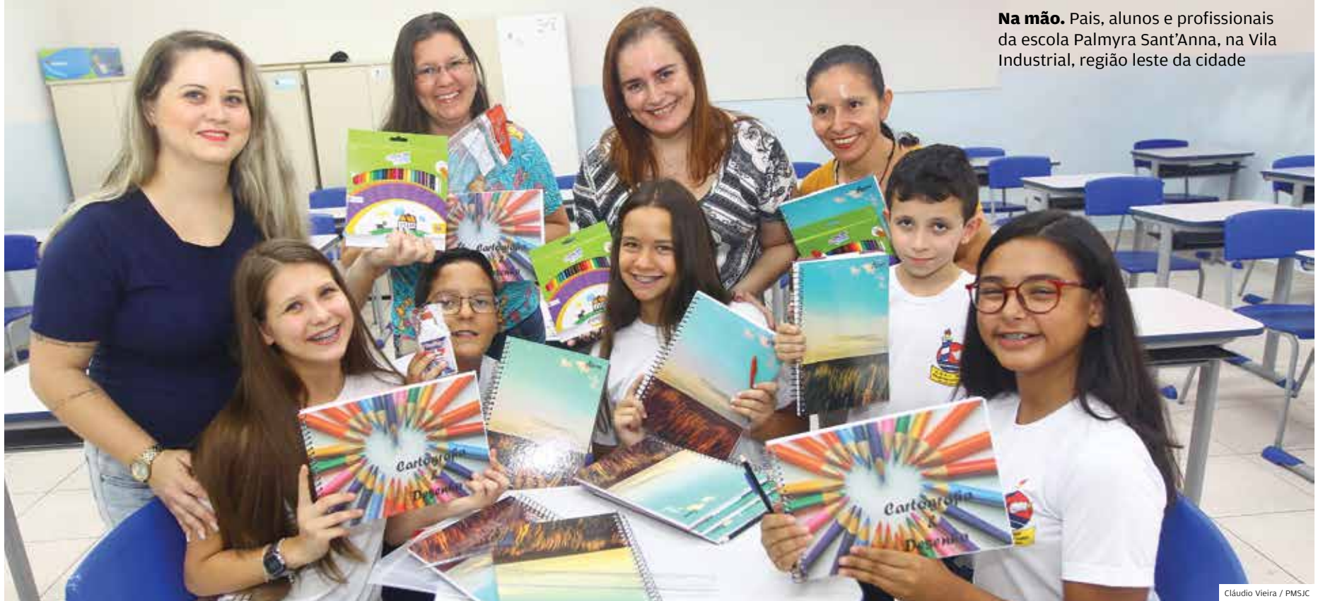
Na mão. Pais, alunos e profissionais da escola Palmyra Sant'Anna, na Vila Industrial, região leste da cidade

Alunos retornam com material escolar de qualidade, escolas reformadas, professores capacitados e disposição de sobra. E vem mais aí: novas unidades estão sendo construídas