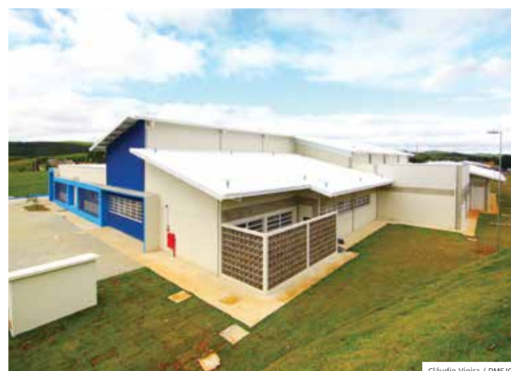
Nova. Escola do Pinheirinho foi entregue em 2019 pela Prefeitura