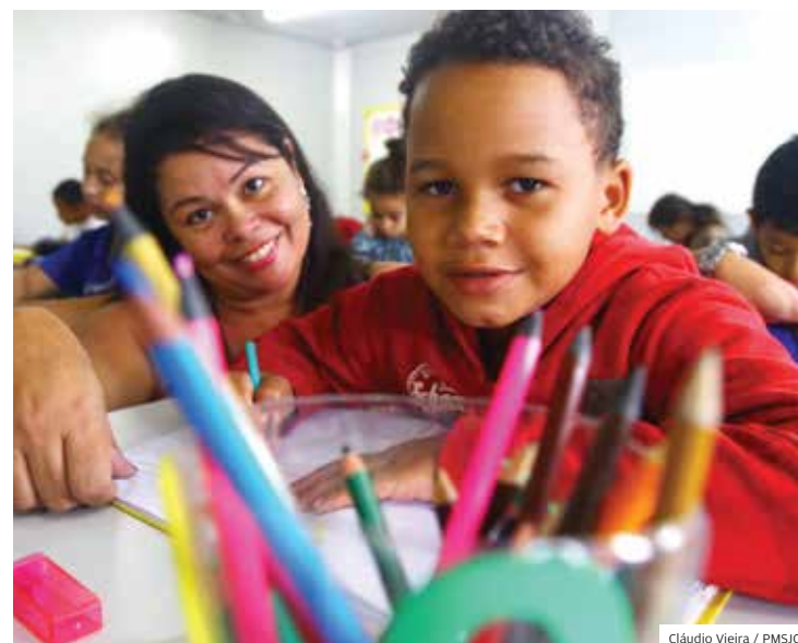
Estrutura. Escolas de São José têm boas notas no Ideb