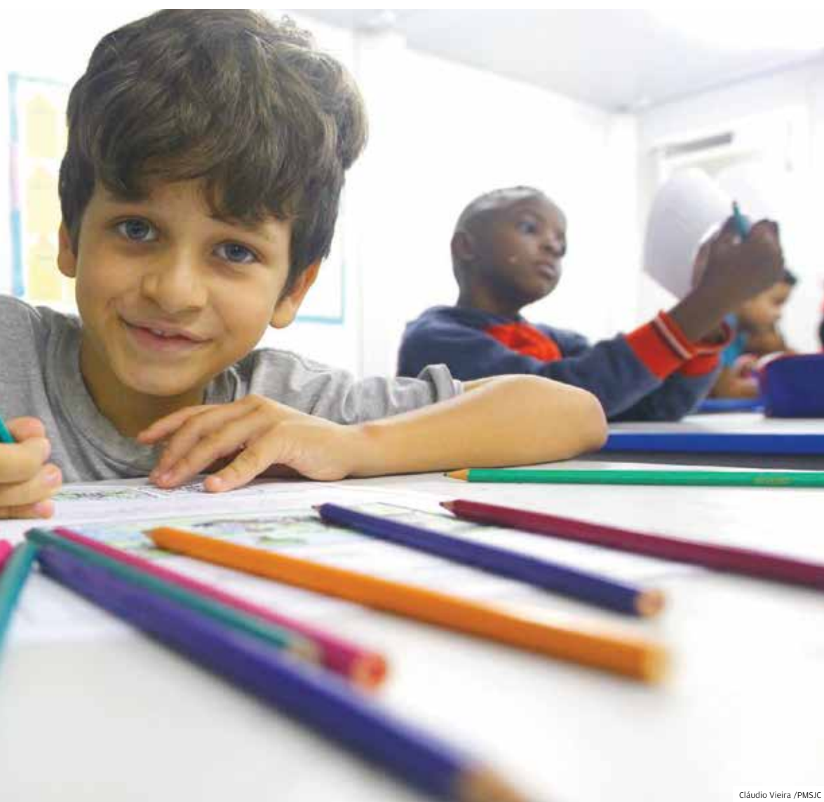
A alegria no reencontro com os amigos. Alunos recebem material escolar logo no primeiro dia de aula