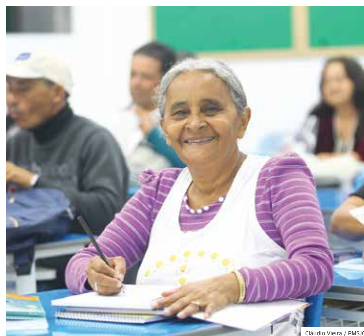
Ensino. Alunos da EJA também receberão materiais escolares