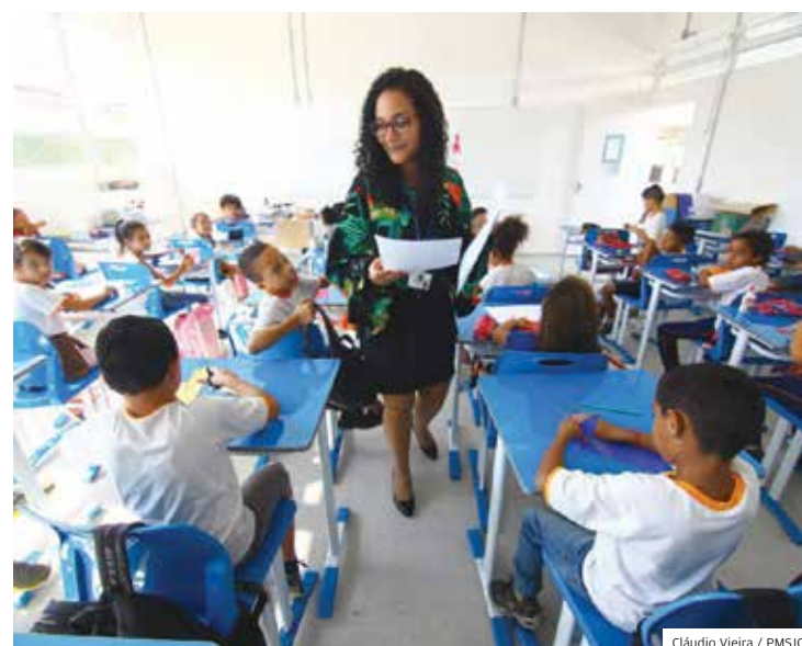
Estrutura. Salas limpas e professores capacitados para as aulas