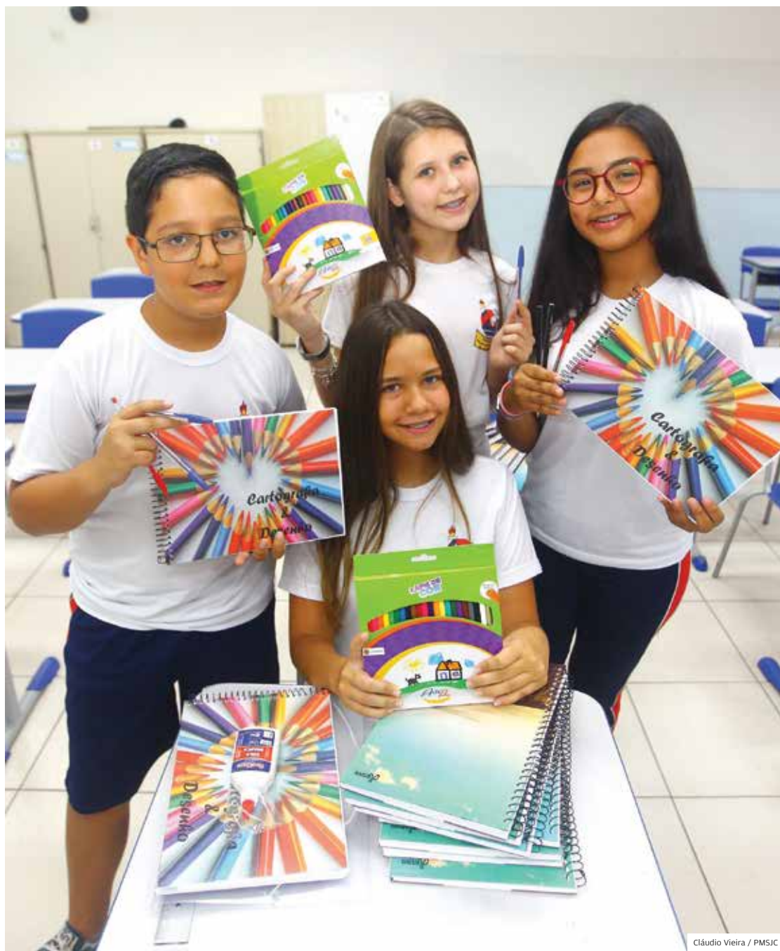
Cheiro de novo. Alunas da escola Palmyra Sant'Anna conferem material que será entregue em 2020