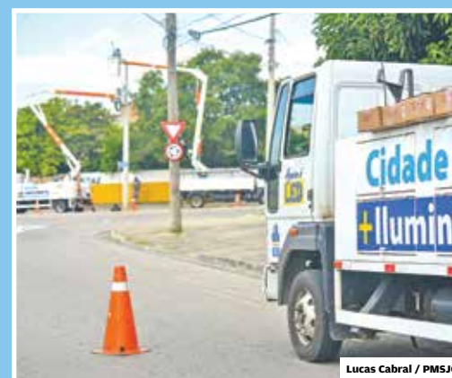
Lucas Cabral / PMSJC