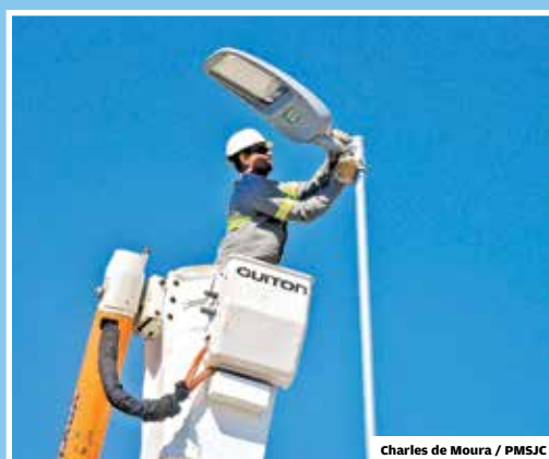
Charles de Moura / PMSJC