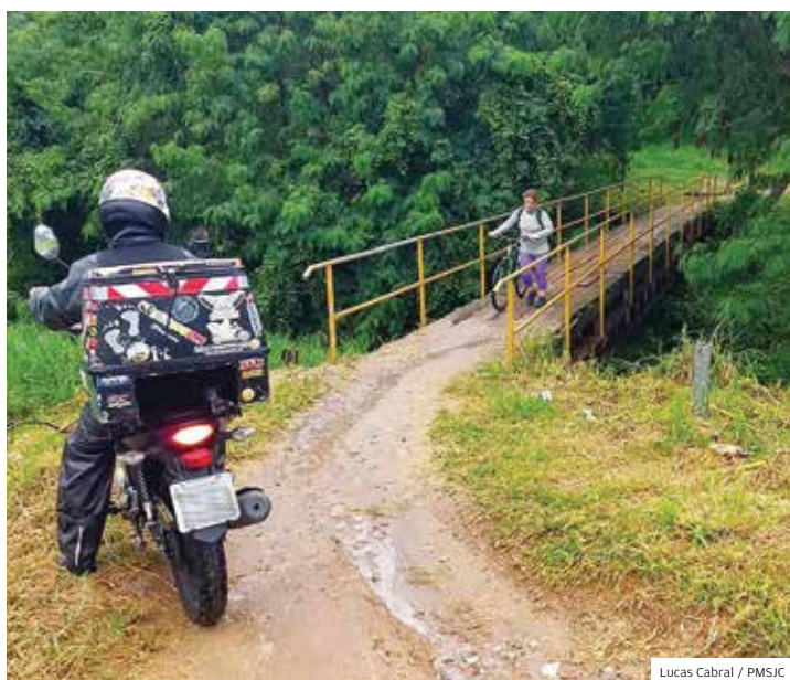
Praço. Em 12 meses, região sul ganhará uma nova interligação