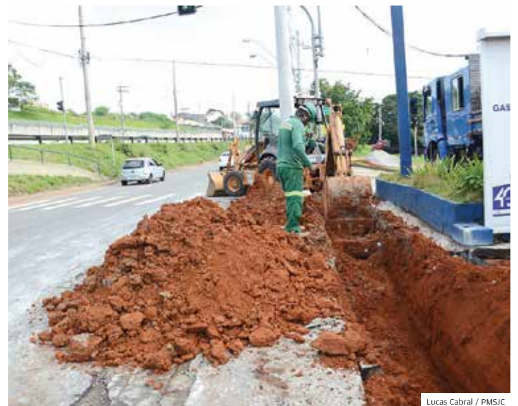
Solução. Obra da rotatória vai destravar os gargalos do trânsito