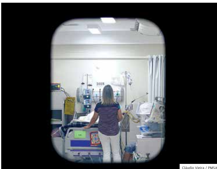
Investimento. Reforma da estrutura custou cerca de R$ 700 mil

A segunda fase da Campanha Nacional de Vacinação contra Influenza começou e vai até 31 de maio nas UBSS.