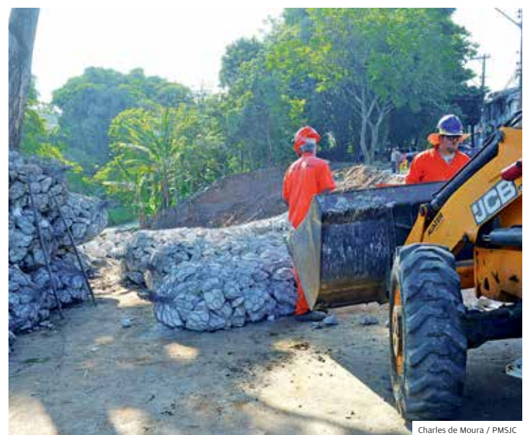
Região sul. Obra de contenção e asfalto da rua Lira, no Satélite

Quilômetros Terá a Via Cambuí, maior obra viária da história de São José e que vai ligar as regiões leste e sudeste