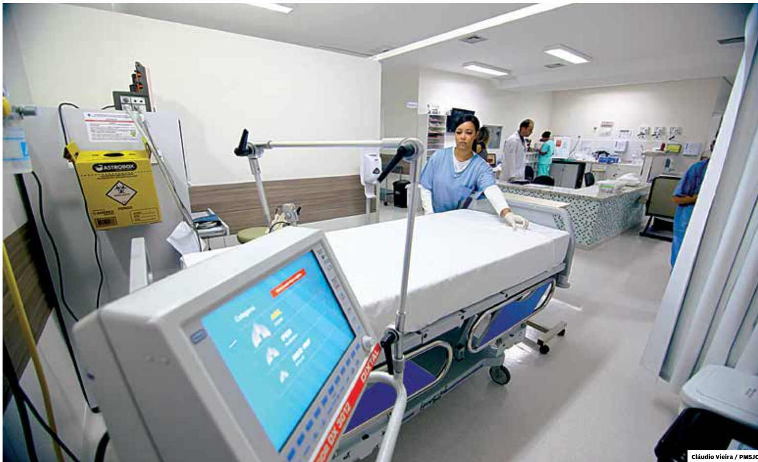
Moderno. Reforma aumentou mais quatro leitos de UTI no Hospital Municipal; esta é a sétima ala do hospital reformada desde 2017

Em março passado, foi entregue o novo Centro Obstétrico. O investimento da Prefeitura somente no atendimento obstétrico foi de R$ 1 milhão. No ano passado, foram reformadas três enfermarias. Em agosto, foi entregue a ala destinada a pacientes cirúrgicos. Em maio, a enfermaria destinada a pacientes cirúrgicos de ortopedia e neurologia. E em janeiro, foram reformados 40 leitos na nova ala de maternidade. Em 2017, foram reformados mais dois setores: a clínica médica e a ala de procedimentos eletivos. A última etapa desta grande reforma será na pediatria, incluindo os leitos de enfermaria e a UTI pediátrica.