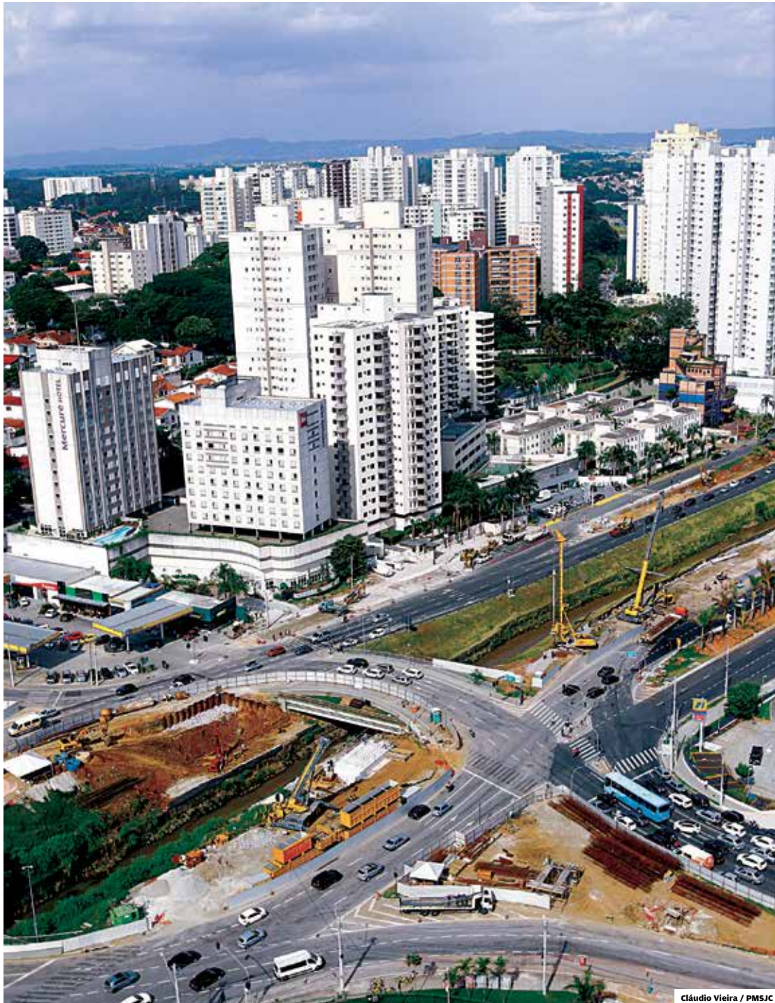
Para o alto. Construção do Arco da Inovação avança com as obras de fundações perto do shopping