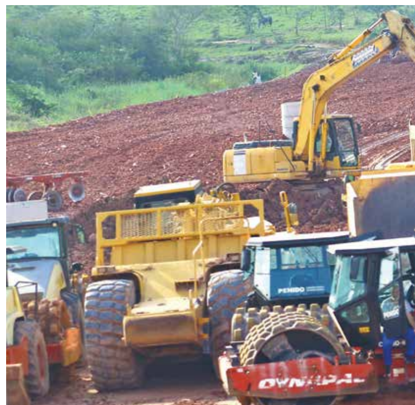
Avançando. Com 57% de serviços feitos, Prefeitura de São José prossegue