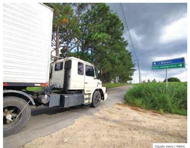
Região Norte. Edital para as obras da Via Jaguari já está aberto