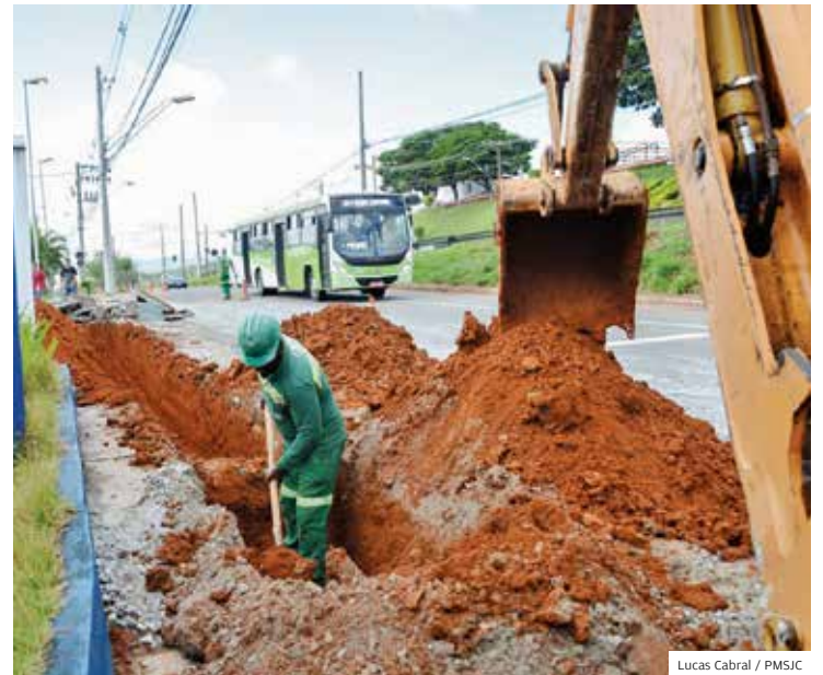
Região leste. Obra na Rotatória do Gás foi iniciada pela Prefeitura