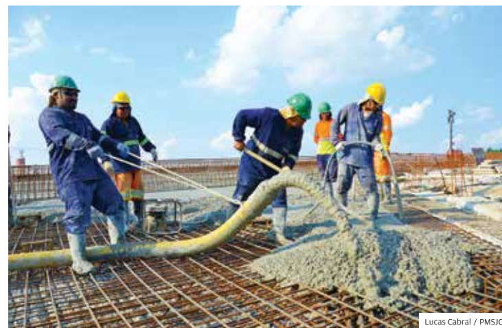
Obra. Concretagem do viaduto da Cambuí começou neste mês

A interligação projetada pela Prefeitura irá beneficiar e facilitar o acesso entre os bairros como Parque dos Ipês, Dom Pedro e Campo dos Alemães, com o Bosque dos Eucaliptos e Jardim Del Rey. A previsão é que a obra no local seja concluída em 12 meses.