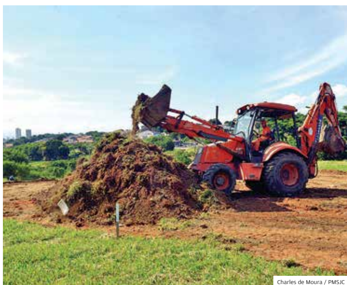
Região Sul. Interligação Salinas/Evangélicos já foi iniciada