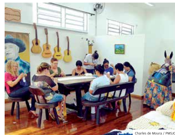
Crocheterapia. Ação leva cultura a pacientes de S. José