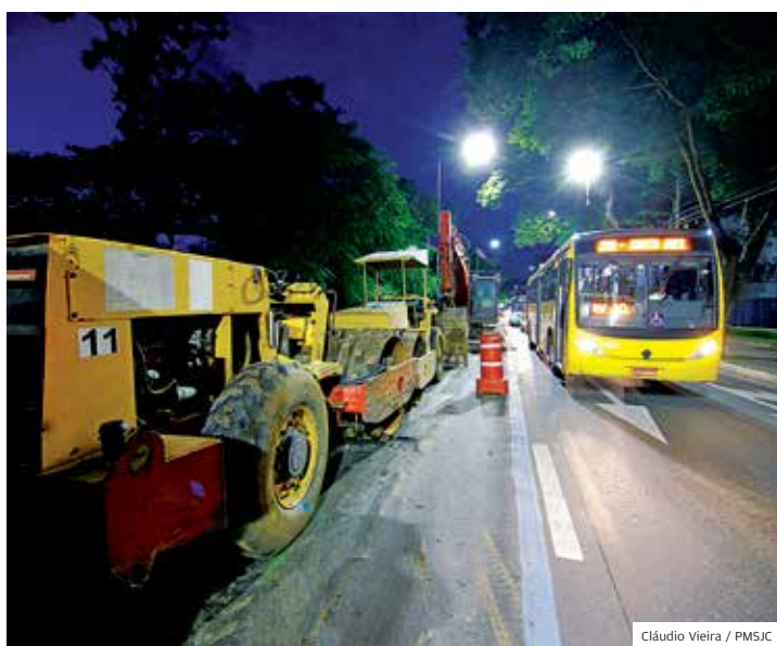
Noturno. Equipes trabalham dia e noite para concluir a obra