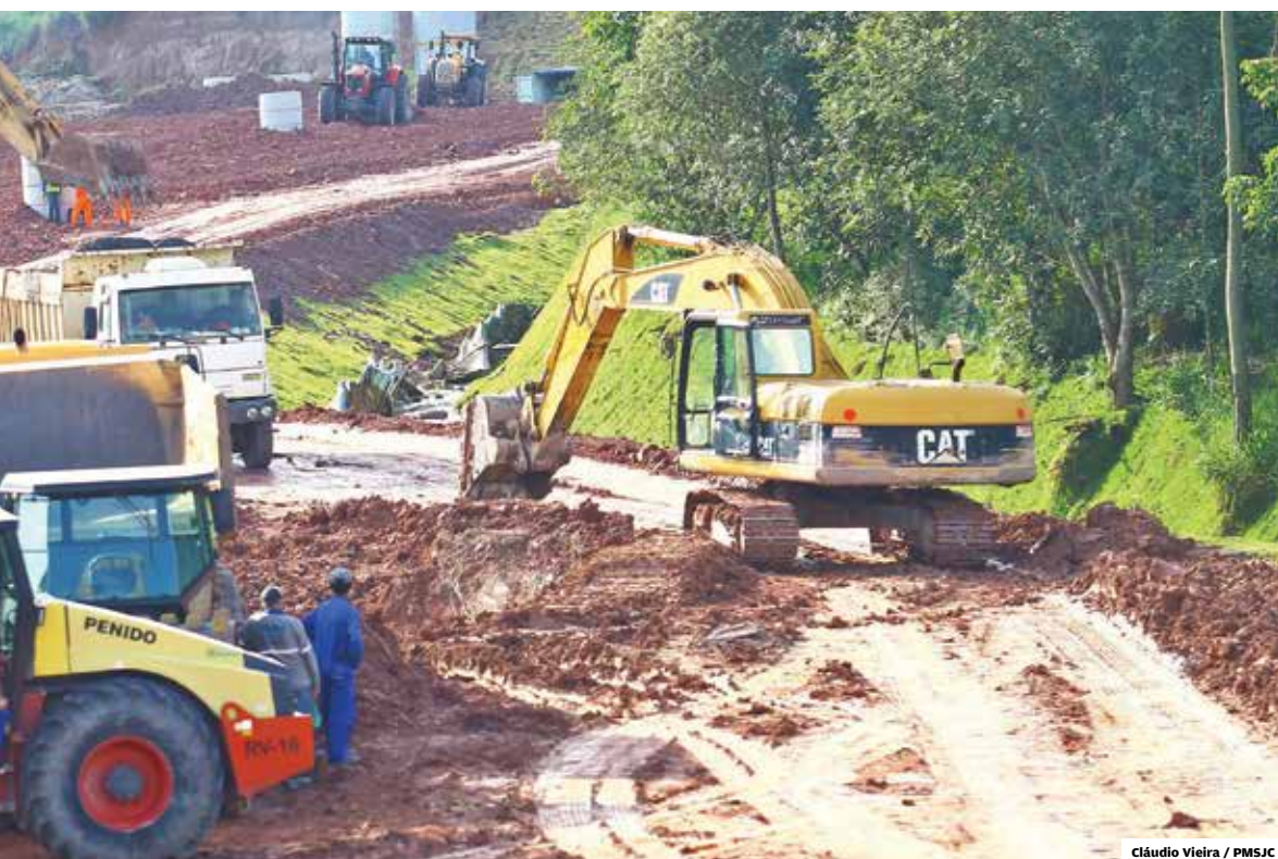
em ritmo acelerado com a construção da via Cambuí ao longo dos 8,6 quilômetros de extensão