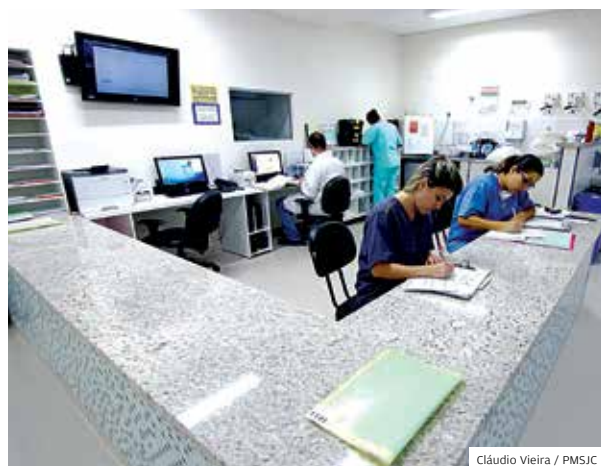
Atendimento. Recepção da nova UTI do Hospital

São atendidos diariamente no Pronto-Socorro do Hospital Municipal; são feitas 800 cirurgias/mês