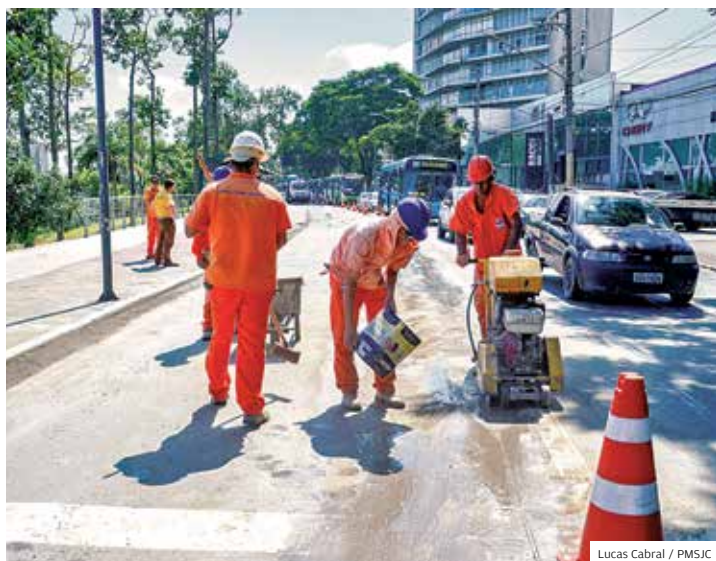
Avenida São José. Recuperação de asfalto beneficia passageiros

INFRAESTRUTURA VIA CAMBUÍ, ROTATÓRIA DO GÁS, INTERLIGAÇÃO SALINAS-EVANGÉLICOS, ARCO DA INOVAÇÃO SÃO ALGUMAS OBRAS INICIADAS