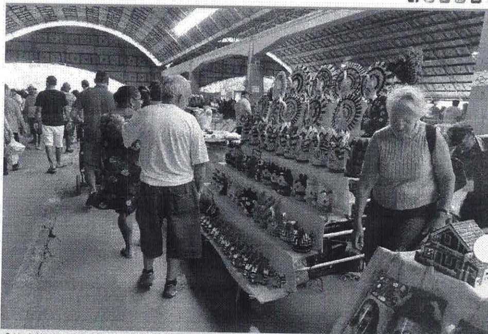
Festa do Mineiro realizada em 2018; exposição e venda de artesanato é um dos principais atrativos do evento