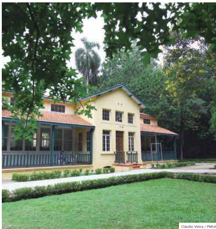
Restaurado. O Pavilhão Alfredo Galvão, onde vai ficar a cafeteria

Com uma área de 960 mil metros quadrados, o Parque da Cidade está situado na antiga Fazenda da Tecelagem Parahyba e virou parque em 1996.