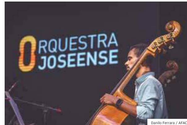
Orquestra. Integra o Programa de Formação Artística