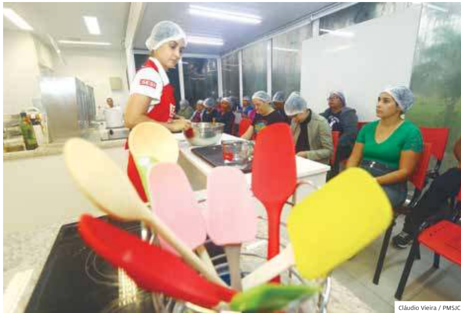
Comida. Alunos na aula de culinária; Qualifica oferece vagas

PROPOSTA A AMPLIAÇÃO DA OFERTA DE CURSOS OFERECIDOS PELO CEPHAS INTEGRA O PLANO DE GESTÃO 2021-2024