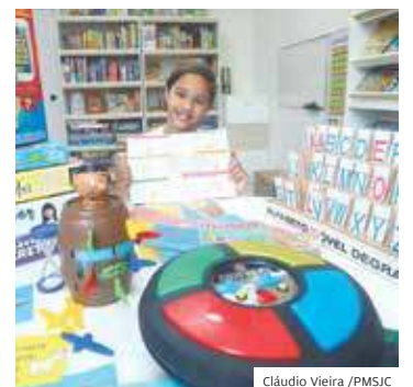
Cláudio Vieira / PMSJC

Pontos. Segundo Indsat, a Educação municipal tem 719 pontos