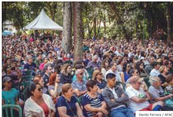
Sucesso. Público prestigia eventos feitos no parque