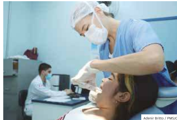
Adenir Britto / PMSJC

Cuidado. Paciente atendida no Hospital Municipal