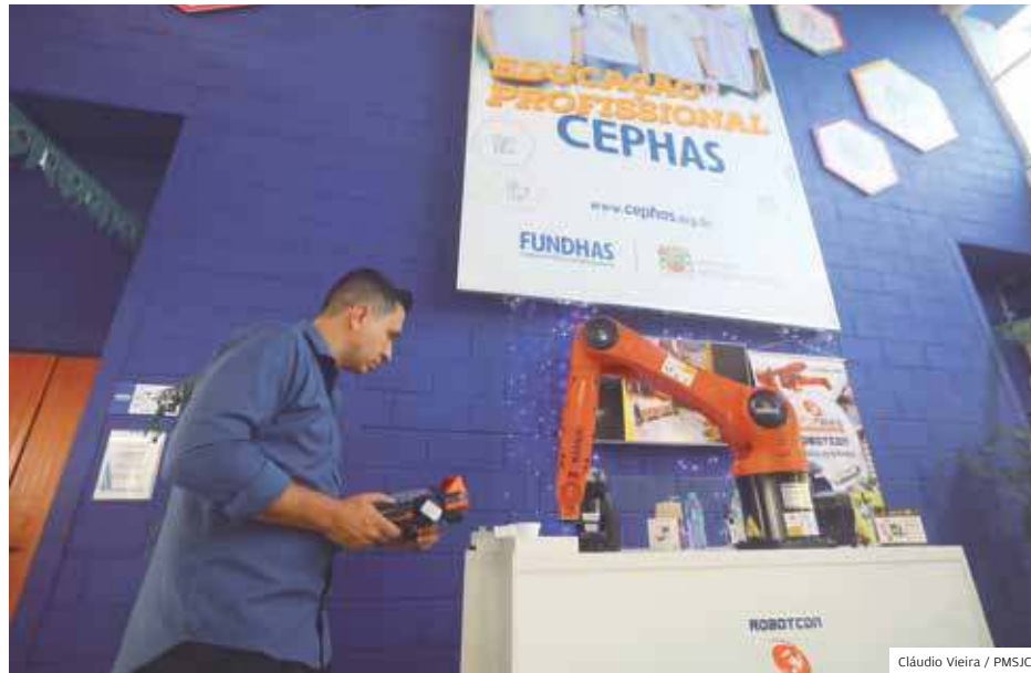
Oferta. Cephas oferece cursos em diversas modalidades