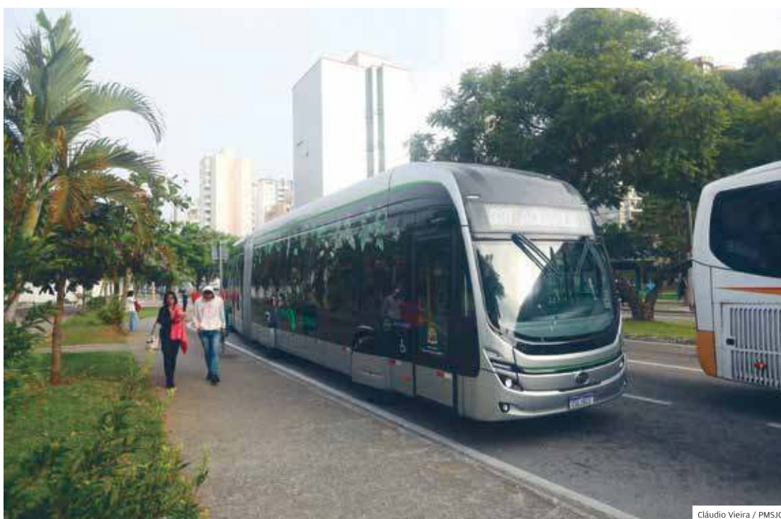
Sul-Oeste. Linha saiu do Campo dos Alemães, na região sul, com destino ao Aquarius, na região oeste