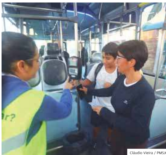
Auxílio. Passageiros têm ajuda de funcionários

E a linha 341B Partida ECO - Campos de São José/Via José Longo parte às 6h38.