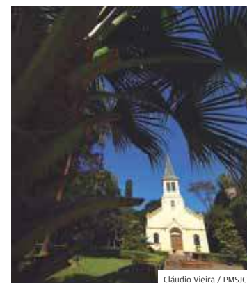
Capela. Igreja do parque foi restaurada recentemente