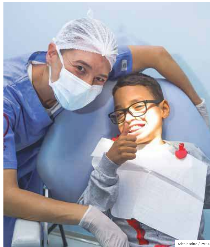
Adenir Britto / PMSJC

Procedimentos Realizados no primeiro ano do PAD Odonto, que atende pacientes acamados em São José dos Campos