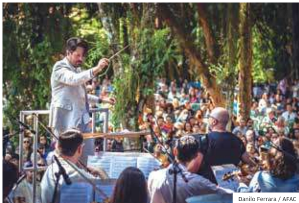
Som. Orquestra Joseense nos 99 anos do Vicentina

ESTRUTURA JÁ O PARQUE DA CIDADE GANHOU MAIS 5 CONJUNTOS DE MESAS E BANCOS DE MADEIRA PARA ENCONTROS E REFEIÇÕES