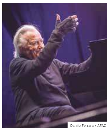
Lotado. João Carlos Martins