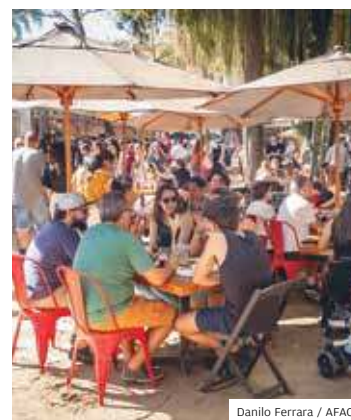
Atrações. Mais de 25 bares

COMIDA. Entre os dias 14 e 16 de abril, o Parque Vicentina Aranha recebeu o Festival +Gastronomia, promovido pelo Destination São José dos Campos, entidade sem fins lucrativos. Com mais de 25 operações gastronômicas de bares e restaurantes da região, o evento contou com shows musicais, intervenções, bate-papos e outras atrações.