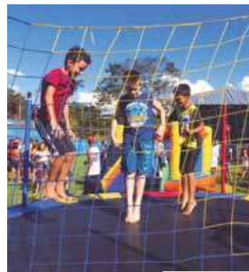
Adenir Britto / PMSJC

JUVENTUDE. Em abril, a Prefeitura de São José realizou uma nova edição do Conexão Juventude, na Vila São Geraldo, região norte de São José dos Campos. A garotada se divertiu bastante nas atrações oferecidas pelo programa. Confira as próximas edições no site da Prefeitura de São José ( www.sjc.sp.gov.br ).