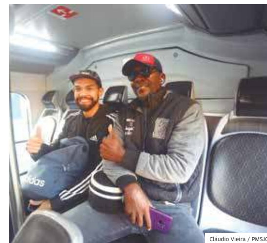
Aprovado. População gostou da novidade