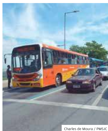
Norte. Melhoria a usuários

AMPLIAÇÃO. Usuários da linha 124 (Buquirinha 2/ Avenida Dr. João Guilhermino), em São José dos Campos, agora são atendidos com aumento de viagens e com a ampliação da cobertura de atendimento. A linha passará a atender as avenidas Doutor Adhemar de Barros, Heitor Vila Lobos e Francisco José Longo.