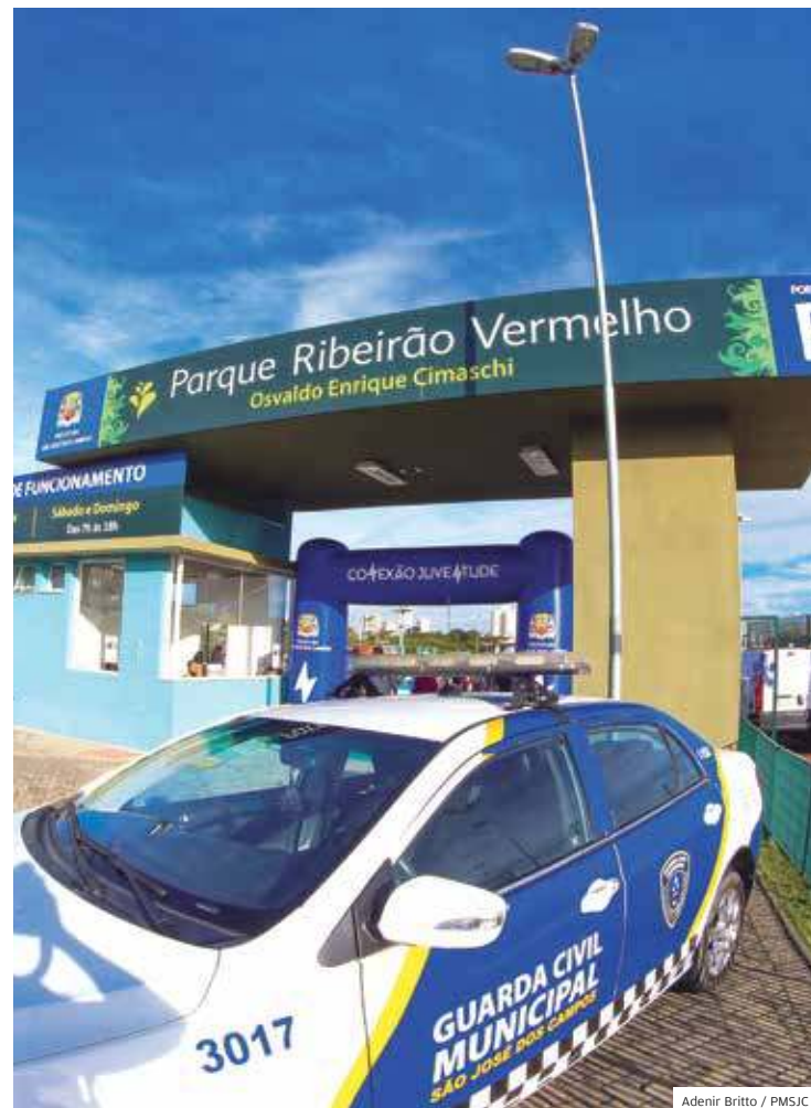
Parque. Fachada do parque Ribeirão Vermelho, na região oeste

Quadrados tem o Parque Ribeirão Vermelho, onde a Prefeitura fez as novas quadras de areia