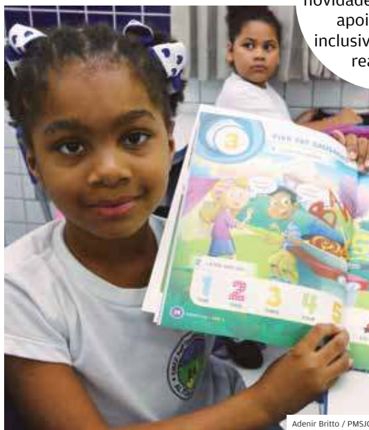
Adenir Britto / PMSJC

INGLÊS. Alunos estão animados com a novidade; nas escolas, apoio escolar inclusivo também é realidade