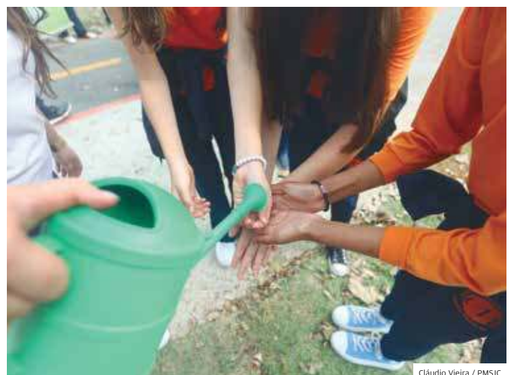
Arborização. Investimento em plantio de árvores pela cidade

5000 Mudas Serão plantadas pela Prefeitura de São José dos Campos em toda a cidade ainda neste ano