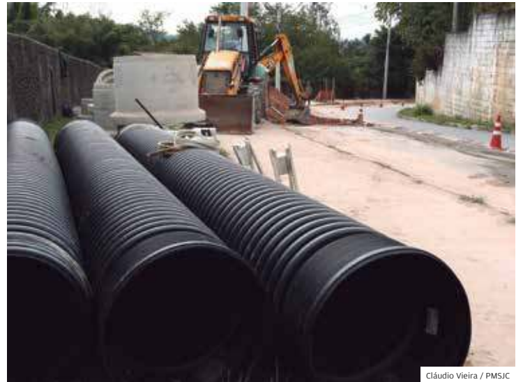
Sul. Execução da nova galeria e bocas de lobo na rua João Miacci