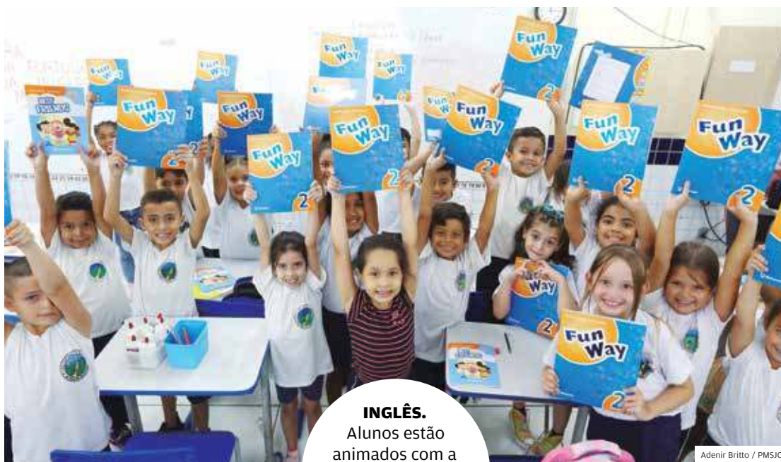
Adenir Britto / PMSJC

EMPREENDEDORISMO Educação Empreendedora para 38 mil alunos de São José dos Campos.