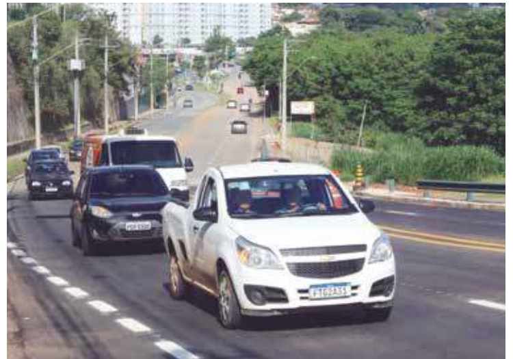
Região leste. Obra na João Marson, na Vila Industrial