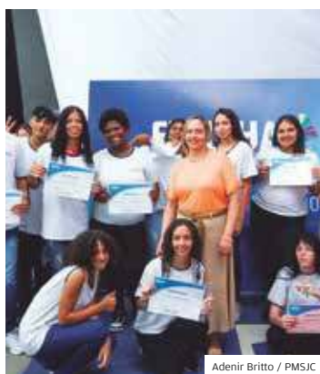
Adenir Britto / PMSJC

CONQUISTAS. Fevereiro foi especial para 788 adolescentes de 15 a 18 anos que receberam certificados de conclusão de 19 cursos de iniciação profissional realizados nos Centros de Inovação Sul, Norte e Eugênio de Melo da Fundhas (Fundação Hélio Augusto de Souza), em São José dos Campos. A solenidade foi realizada na sede da instituição, no Parque Industrial.