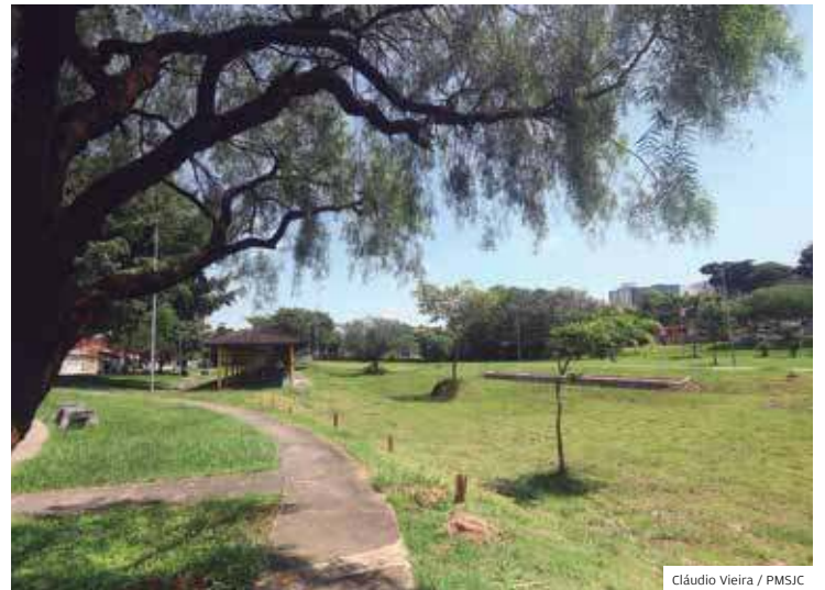
Oeste. Praça Hélio Augusto de Souza, no Jardim das Indústrias

VERDE. A Prefeitura de São José dos Campos também investe na arborização urbana, que é de extrema importância para o equilíbrio ambiental na cidade. As árvores, além de melhorarem a qualidade do ar e o conforto térmico, interceptam a água das chuvas. As copas das árvores criam barreiras que diminuem a velocidade da água da chuva a partir do contato com as folhas. Sendo assim, parte da água fica retida nas folhas, enquanto outra parte desce até o solo, infiltra e contribui para evitar alagamentos. O Plano Municipal de Arborização Urbana é o principal instrumento para o planejamento e gestão da arborização urbana do município. A meta principal é realizar o plantio de 56 mil árvores nos próximos 12 anos. Entre 2018 e 2022, a cidade já plantou 4.895 mudas. Para 2023, o objetivo é realizar o plantio de mais 5.000 mudas ainda neste ano. O Arboriza São José integra um conjunto de ações para gestão do patrimônio arbóreo de São José.