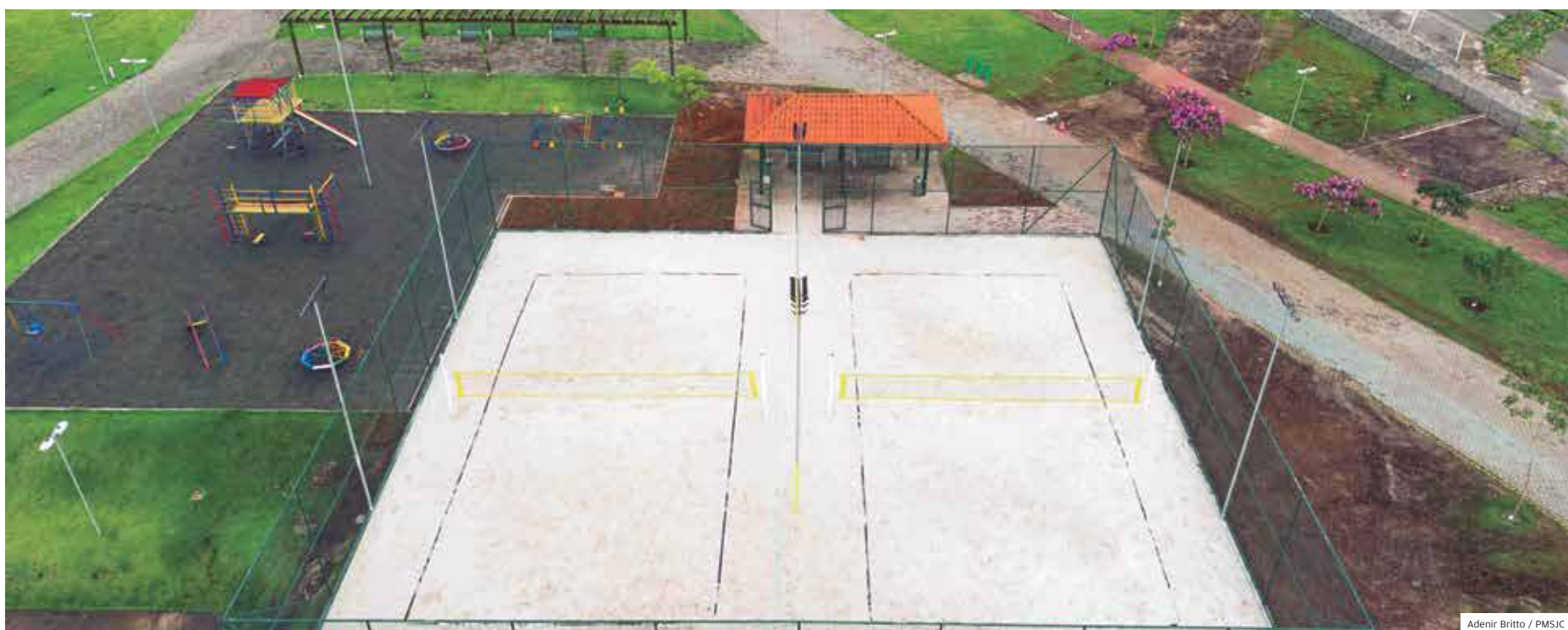
Equipamento. Os usuários deverão levar o equipamento próprio para a prática esportiva, como raquetes e bolas, cabendo à Prefeitura o fornecimento das redes