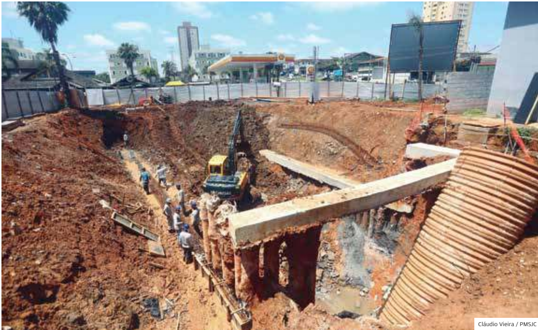
Região sul. Recuperação de galeria de águas pluviais no Jardim Morumbi, região sul da cidade