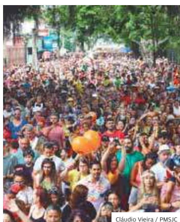
Carnaval. De volta

VICENTINA. O bloco Galinha D'Angola animou milhares de pessoas no Carnaval em São José dos Campos. Os foliões tomaram conta das ruas e avenidas no entorno do Parque Vicentina Aranha, na região central. Com músicas consagradas do carnaval, o bloco atraiu famílias, grupos de idosos e pessoas de todas as idades.