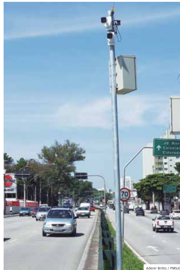
Adenir Brito / PMSJC

Tecnologia. Instalação de câmera no Jardim Limoeiro