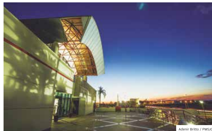
Adenir Brito / PMSJC

JK. Avenida Juscelino Kubitschek, na Vila Industrial, região leste da cidade, já conta com o sistema de semáforos inteligentes