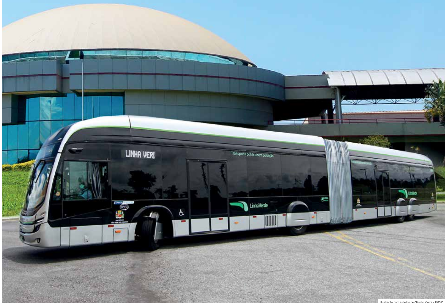
Ilustração com as fotos de Cláudio Vieira / PMSJC

São José apresenta o primeiro VLP 100% elétrico do país, que irá integrar o novo transporte público e tráfegar na Linha Verde. Veículo ficou em exposição e foi aprovado por visitantes