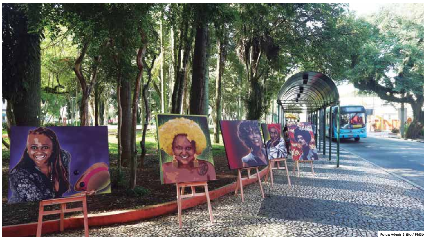
Arte. As 16 telas de tamanhos e formatos diferentes que percorreram os pontos de ônibus localizados na região central de São José