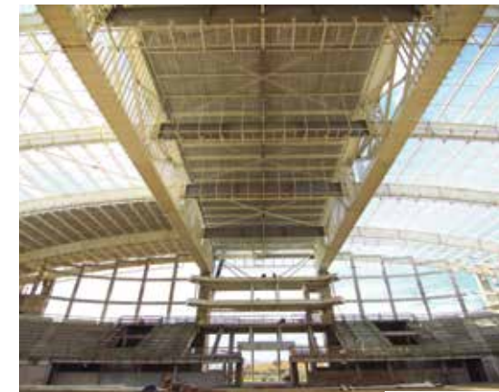
Moderno. Complexo está na fase de telhamento