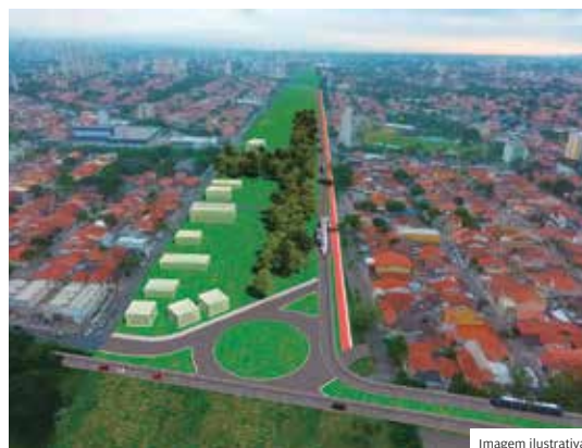
Linha Verde. Cetesb emitiu licença para obra