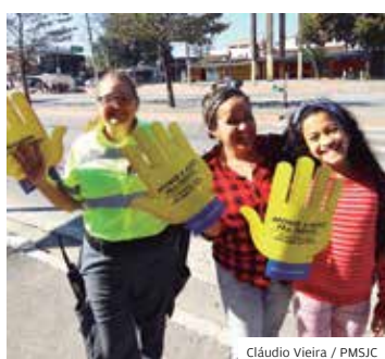
Ruas. Ação nas principais vias

A campanha #SinaldeGentileza já impactou mais de 200 mil. O balanço é do Educamob, setor de educação para o trânsito. Entre as ações do programa da Prefeitura, está a operação pedestre, realizada principalmente em faixas não semaforizadas da cidade.