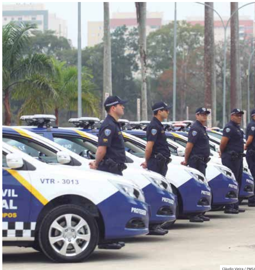
Inovação. Com uma única recarga, carros elétricos rodam até 400 quilômetros

A frota da Guarda Municipal é a primeira no Ocidente a ter veículos 100% elétricos. São 30 carros para reforçar a segurança no município. A aposta no futuro faz sentido. Os veículos são mais econômicos, não poluentes, com menor custo de manutenção e ótimo desempenho.