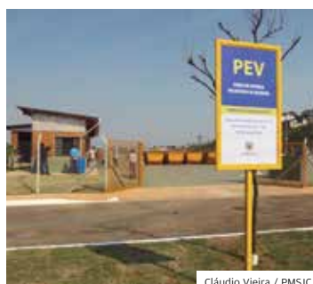
Unidade. PEV na região sudeste: são 15 na cidade

A Prefeitura entregou em junho o novo PEV (Ponto de Entrega Voluntária de Resíduos) Urbanova, na região oeste. São José dos Campos passa a ter 15 unidades espalhadas por todas as regiões do município.