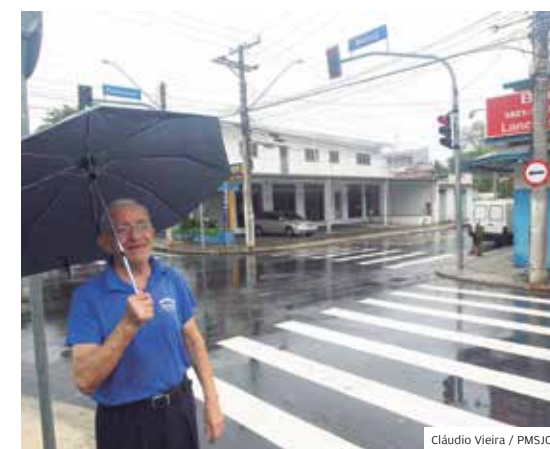
Chuva. Obra antienchente do Jardim Augusta