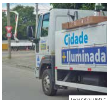
Investimento. Cidade investiu R$ 40 milhões no Iluminar

A Prefeitura de São José está investindo R$ 40 milhões no Projeto Iluminar.