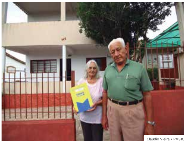
Posse. Títulos de posse em todas as regiões