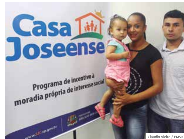
Moradia. Casa Joseense viabilizou sonhos