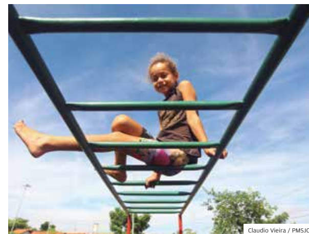
Programa. Minha Praça de Volta melhorou espaços