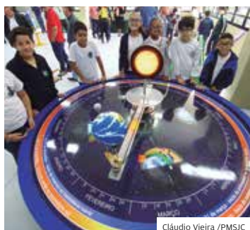
Diversão. Museu Interativo fica na Vila Industrial

Com instalações modernas, o Museu Interativo de Ciências foi aberto há 2 anos e segue o formato do Projeto Catavento. No local, há atividades e exposições sobre ciência e cultura. No total, são mais de 50 atrações disponíveis para os visitantes.