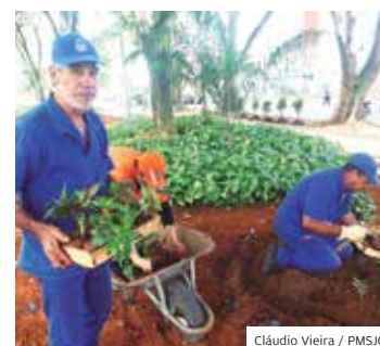
Árvores. Plano de Ação inclui a ampliação de plantios

São José integra o trio das primeiras cidades brasileiras homenageadas com o reconhecimento de Tree Cities of the World, oferecido pela ONU. Cidade foi reconhecida por seu compromisso com o manejo florestal urbano.