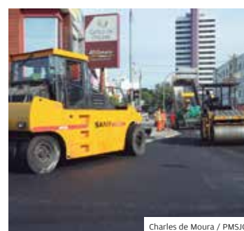
Ação. Asfalto em 12 vias

O programa Asfalto Novo, executado pela Urbam, segue em ritmo acelerado na cidade e vai beneficiar todas as regiões do município. A primeira fase terá investimento de R$ 10 milhões. As obras vão ocorrer em cinco etapas e beneficiar 12 vias do município.