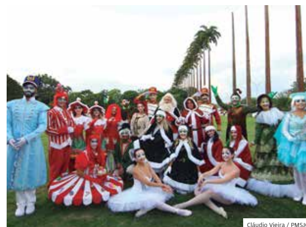
Família. Conexão movimentou todas as regiões