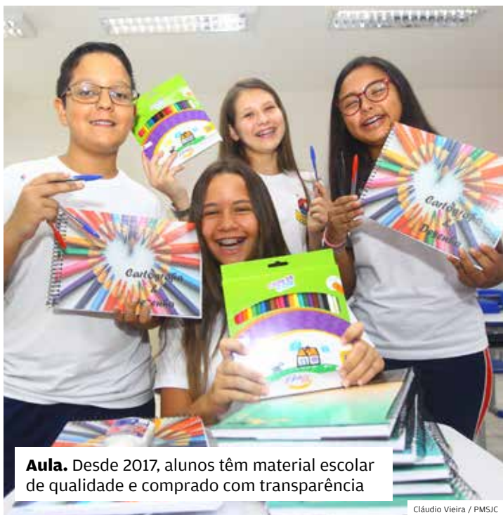
Aula. Desde 2017, alunos têm material escolar de qualidade e comprado com transparência