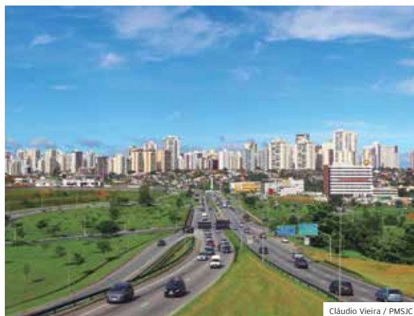
Zoneamento. Nova lei prepara cidade para o futuro