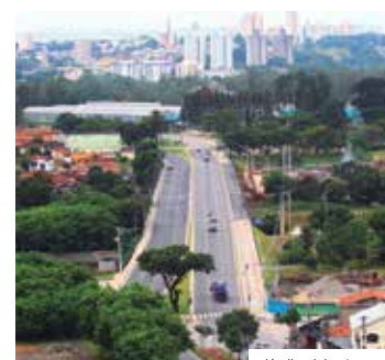
Duplicada. Nova ponte liga Santana aos demais bairros

Com três faixas de rolamento, a nova ligação vai beneficiar cerca de 60 mil moradores da região.