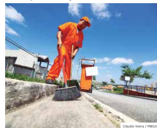
Limpeza. Varrição e coleta são bem avaliadas