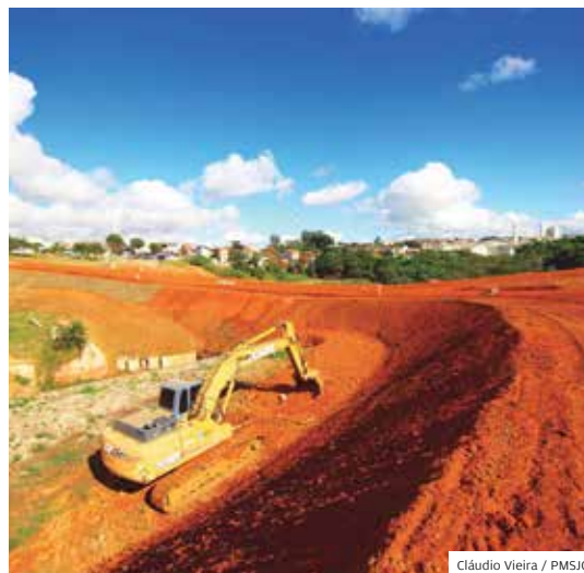
Sul. Ligação das avenidas Salinas-Evangélicos

O Arco da Inovação também já está liberado para os automóveis, desafiando o que era o maior gargalo do trânsito da cidade. AÇÕES. A Linha Verde, nova Rotatória do Gás, a duplicação da ponte Maria Peregrina, o prolongamento da Via Oeste, além da interligação Salinas-Evangélicos são outras ações. O programa Asfalto Novo segue em ritmo acelerado na cidade para beneficiar todas as regiões do município. De acordo com a programação, a primeira fase terá investimento de R$ 10 milhões.