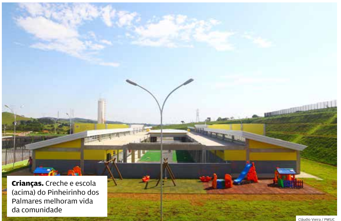
Crianças. Creche e escola (acima) do Pinheirinho dos Palmares melhoram vida da comunidade