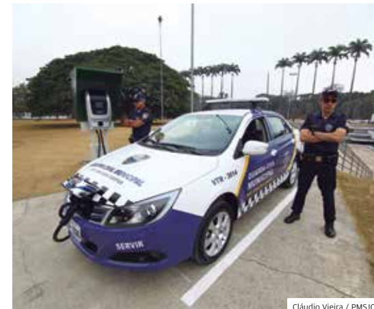
Estratégia. Corporação foi toda equipada