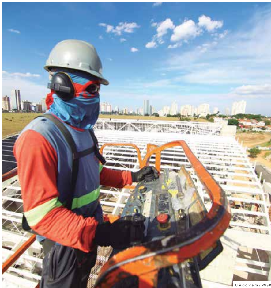
Esporte. Obra da Arena será entregue até o fim deste ano no Jd. das Indústrias

Já o programa Casa Joseense facilita o sonho da casa própria, oferecendo carta de crédito no valor máximo de R$ 5 mil e aporte financeiro até R$ 2.500 para isenção de impostos municipais e taxas.