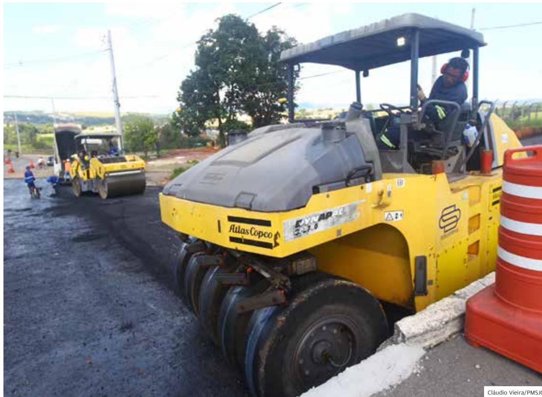
Leste. Obra do túnel na Rotatória do Gás, na região leste de São José, continua para beneficiar cidade

Em março, por exemplo, mais cinco quadras de esportes de São José dos Campos foram recuperadas.