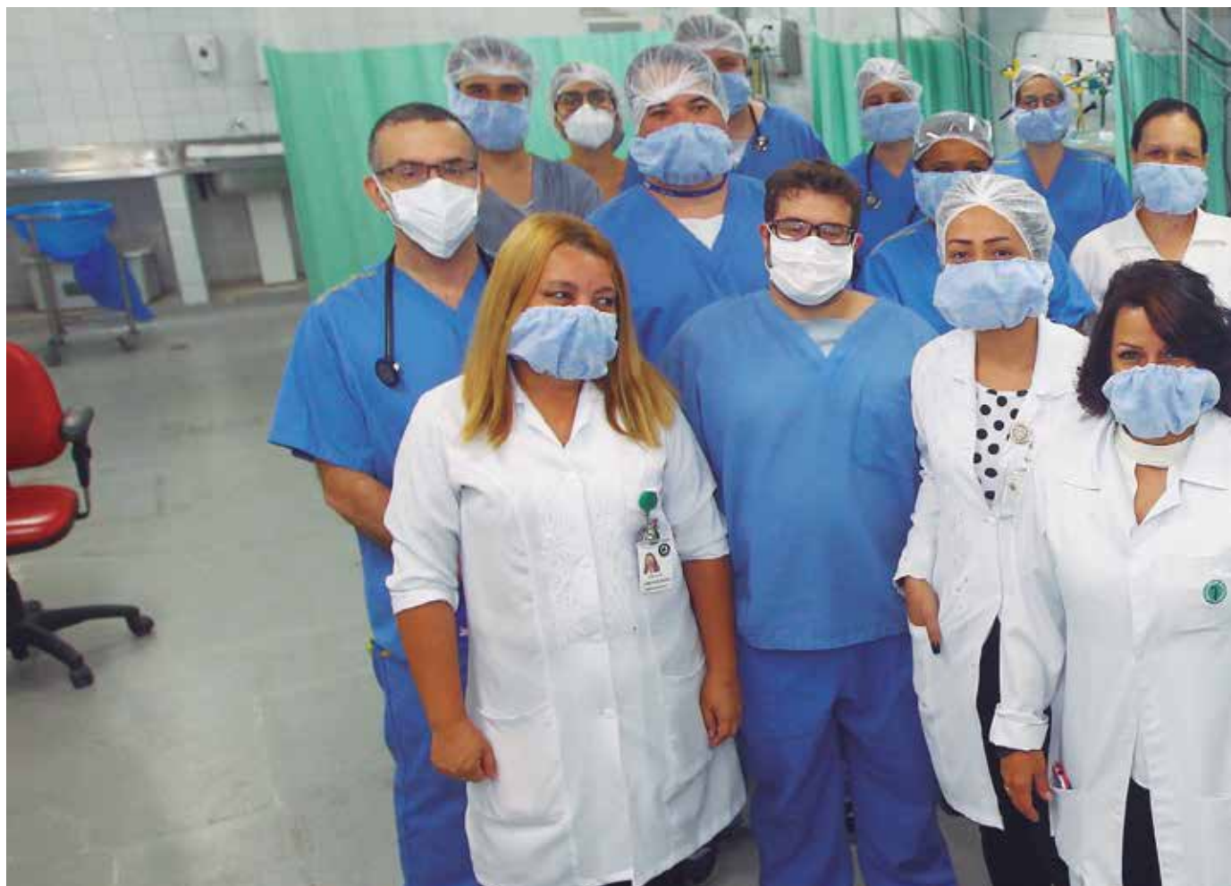
Amor à vida. Profissionais do Hospital Municipal estão preparados para atender os casos de coronavírus de São José dos Campos