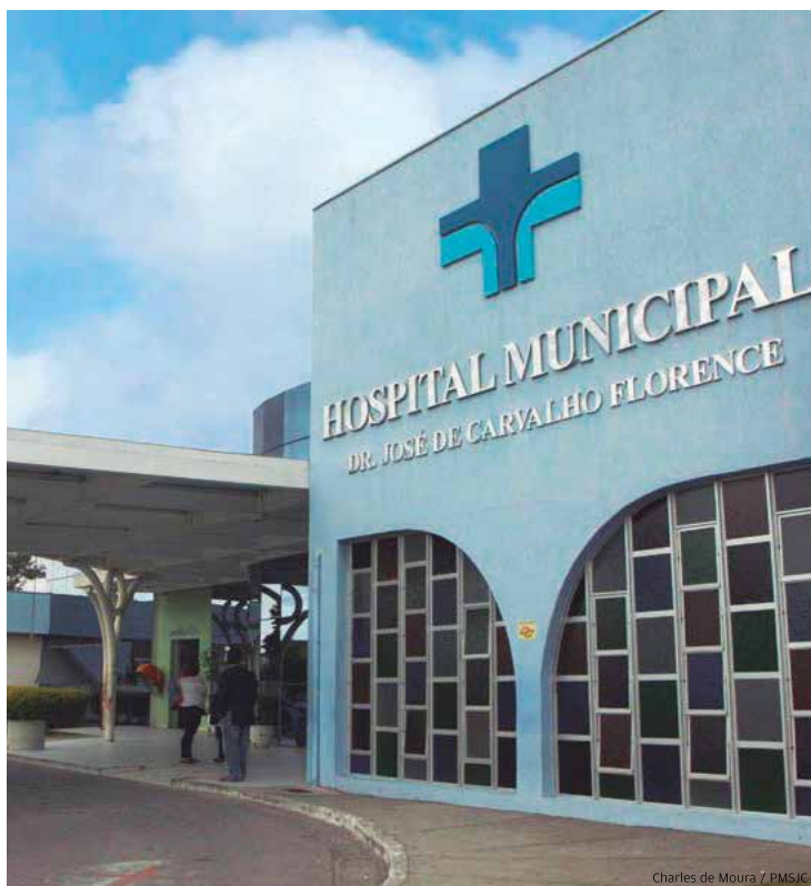
HM. Estão previstos, de março a dezembro, mutirões no hospital

Aos sábados. A Prefeitura de São José dos Campos vai ampliar o número de cirurgias eletivas para pacientes da rede pública de saúde do município. Estão previstos, de março a dezembro, mais de 1.000 procedimentos, por meio de mutirões, no Hospital Municipal. A Secretaria de Saúde já estabeleceu que serão realizadas 800 cirurgias de laqueadura e 210 colecistectomias (vesículas). As cirurgias acontecerão sempre aos sábados, com uma média de 110 procedimentos por mutirão. Cirurgias eletivas são procedimentos realizados através de marcação.