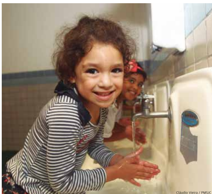
Educação. Escolas de São José dos Campos e Casas do Idoso já estão tomando todos os cuidados na higienização das mãos

Orientação. A Prefeitura reuniu em 28 de fevereiro um grupo de profissionais da rede pública de saúde para apresentar o plano de enfrentamento e contingência para o novo coronavírus (2019-NCOV). No encontro, foi apresentado o modelo que poderá ser colocado em prática para um possível avanço dos casos da doença no município. As orientações servem para a rede pública e privada. Escolas e Casas do Idoso já tomam todos cuidados na higienização das mãos.