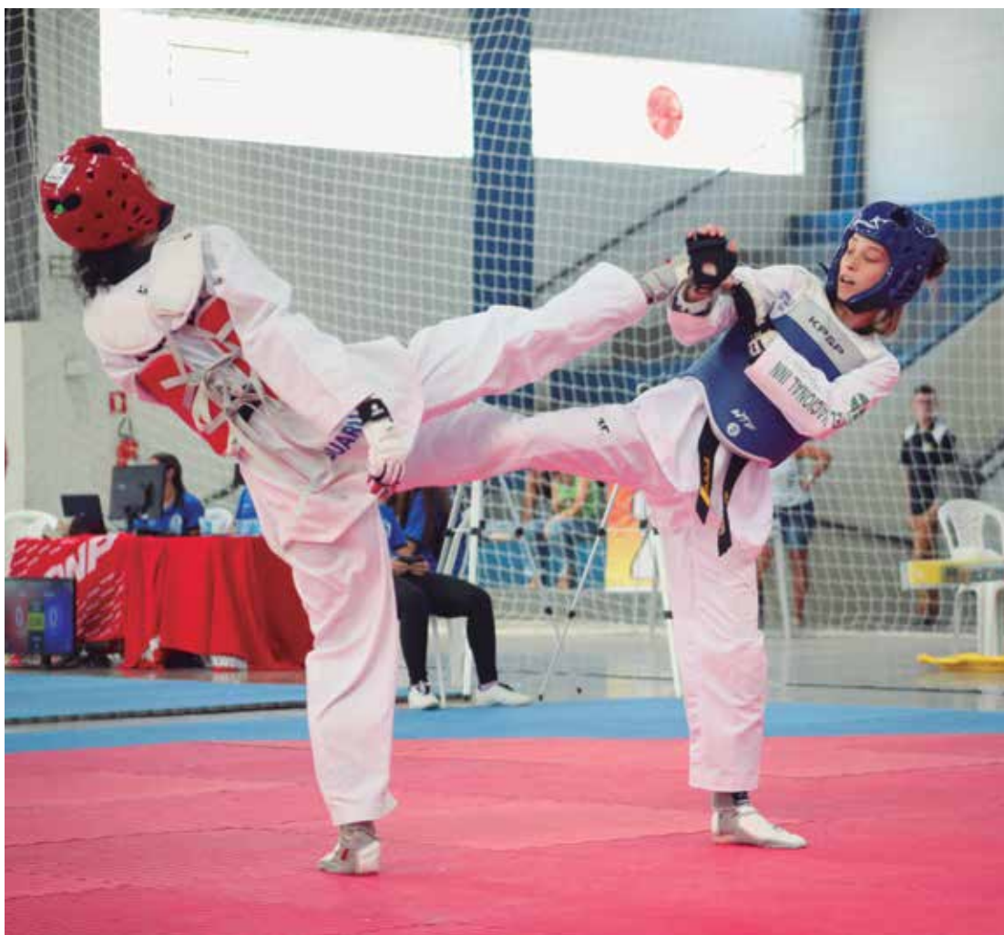
Sucesso. Em uma das edições mais empolgantes dos 83 anos de história dos Jogos Abertos do Interior, São José dos Campos conquistou o tricampeonato consecutivo -2017 / 2018 / 2019