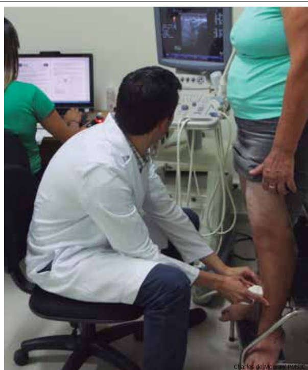
Reformado. Reforma no prédio da UES melhorou consideravelmente as condições de atendimento dos usuários