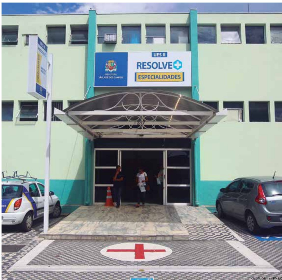
Atendimento. Unidade de Especialidades de Saúde fica na avenida João Guilhermino, 317, centro de São José. O atendimento acontece das 7h às 18h, pelo programa Resolve Mais Especialidades