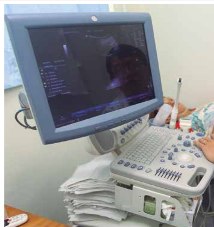
Exames. Serão mais 4.500 exames de ultrassom por mês para

INFRAESTRUTURA ATENDIMENTO É FEITO POR ENCAMINHAMENTO VIA CENTRAL 156 E ACONTECE NA AVENIDA JOÃO GUILHERMINO, DAS 7H ÀS 18H