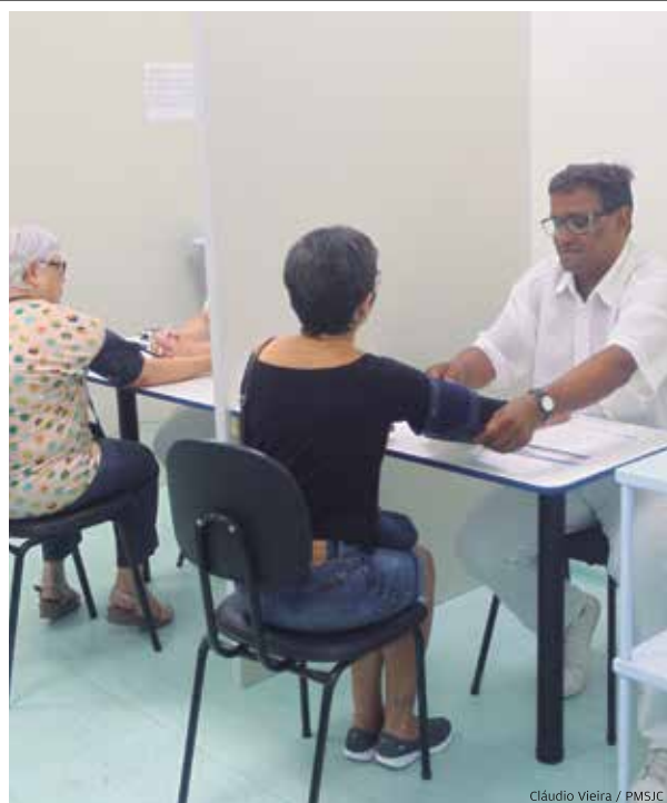
Horário. O atendimento acontece das 7h até 18h