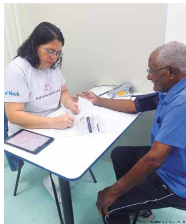
Conforto. Reforma foi entregue em fevereiro