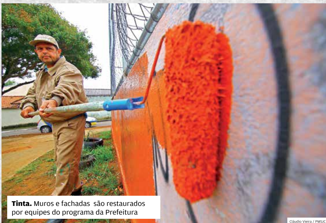
Tinta. Muros e fachadas são restaurados por equipes do programa da Prefeitura