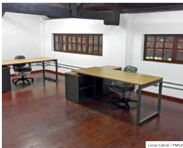
Moderno. Prefeitura reformou e mobiliou o prédio