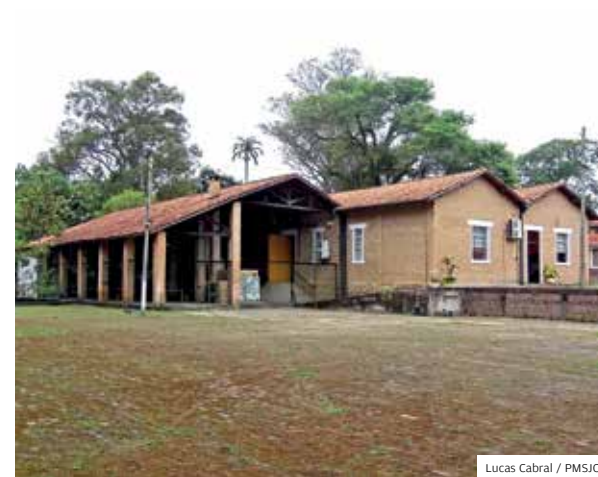
Medidas. A área do imóvel tem cerca de 1.000 m²