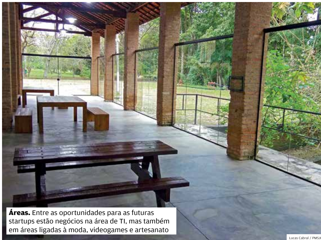
Áreas. Entre as oportunidades para as futuras startups estão negócios na área de TI, mas também em áreas ligadas à moda, videogames e artesanato

A antiga Casa do Café, localizada no interior do Parque da Cidade, passa a sediar, a partir de 16 de outubro, o programa Startup São José, desenvolvido pela Prefeitura de São José dos Campos. A Prefeitura investiu no local cerca de R$ 400 mil, entre reforma do prédio e instalações de novo mobiliário e sistema de informática. A reforma no prédio foi realizada com autorização do Compahac (Conselho Municipal de Preservação do Patrimônio Histórico, Artístico). A área do imóvel tem cerca de 1.000 m². A previsão é que de 6 a 10 startups, escolhidas com base no edital divulgado, ocupem este novo centro de empreendedorismo e desenvolvimento tecnológico. O edital para interessados ainda está aberto tanto para empresas como para parceiros que par-