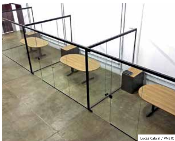
Local. Espaço terá de 6 a 10 startups funcionando

INOVAÇÃO REFORMA DO PRÉDIO HISTÓRICO DA CIDADE FOI REALIZADA COM AUTORIZAÇÃO DO COMPAHAC