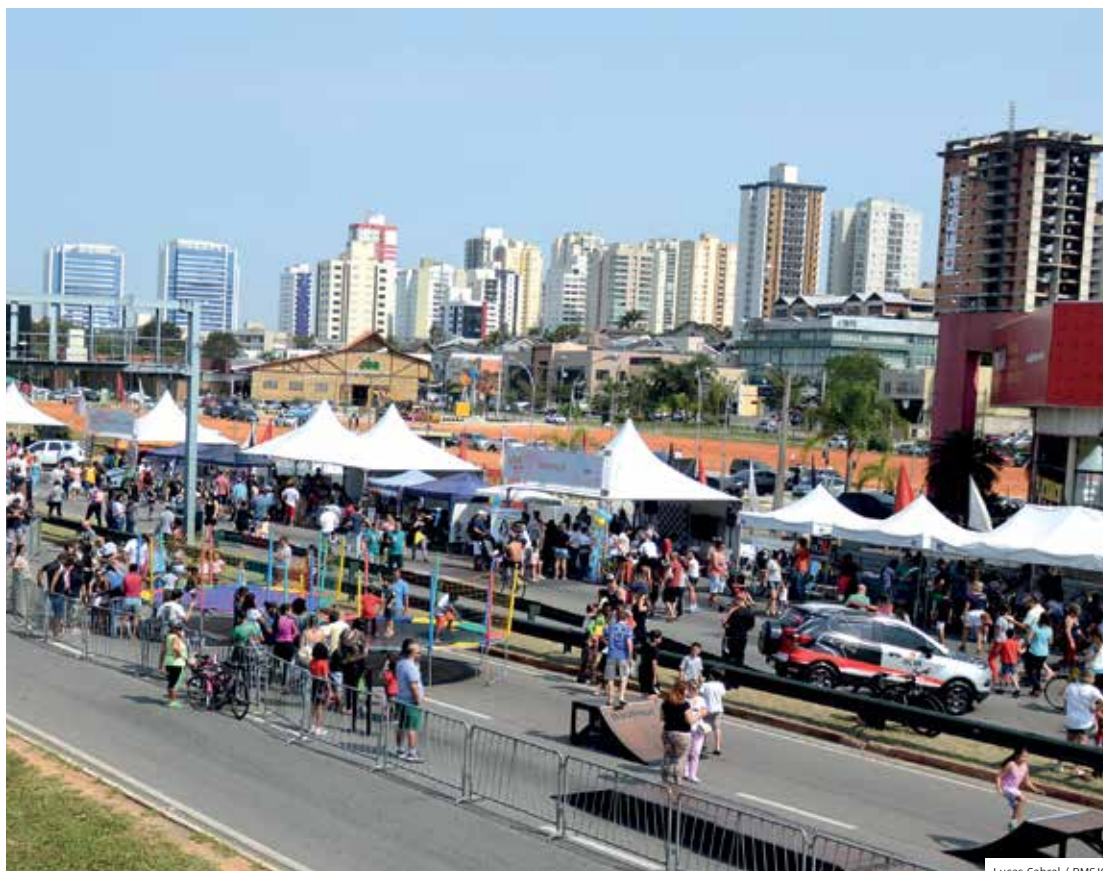
Família. Quem foi ao Anel Viário, no Circuito de Lazer, curtiu atrações destinadas a todos os públicos

O Circuito de Lazer especial foi uma parceria da Prefeitura com a TV Record. Teve atrações para todos os gostos e idades, com muita música, aulas de dança com monitores do Sesi, feira de