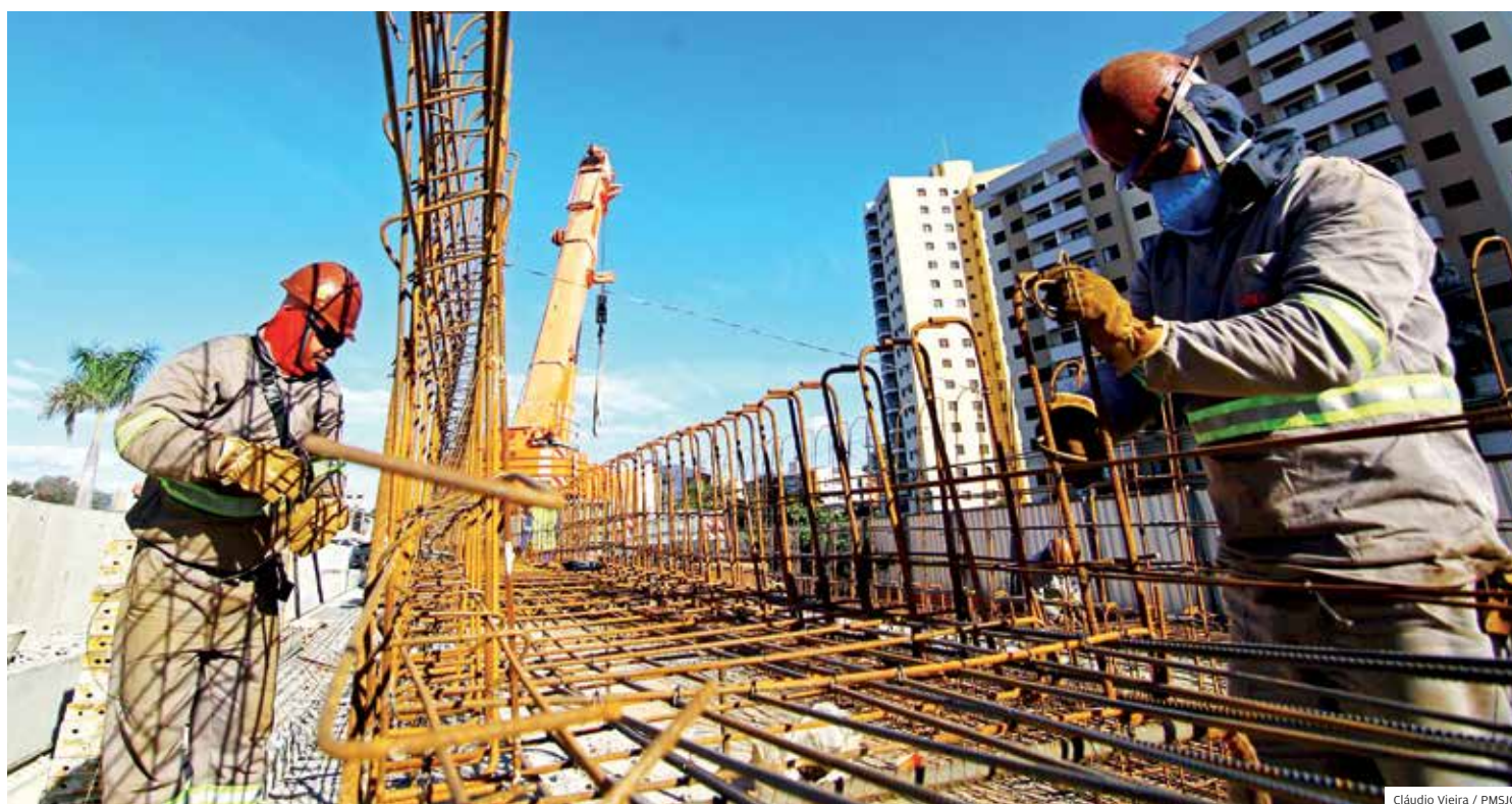
Arco. Canteiro de obras do Arco da Inovação: ponte estaiada vai desafogar principal ponto de congestionamento de São José dos Campos