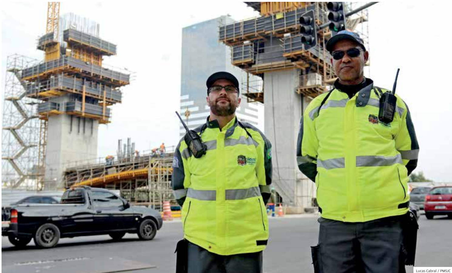
Atentos. Agentes se revezam para organizar o fluxo das grandes obras, como o Arco da Inovação; Anel Viário também tem operações

Em agosto, uma operação especial fechou o Anel Viário no domingo. Apenas para o Circuito de Lazer, por exemplo, foram realizadas diversas reuniões de planejamento que resultaram em uma operação com 18 agentes da mobilidade, bolsões de estacionamento no local do evento, placas e materiais de sinalização para orientação dos motoristas e de rotas alternativas, criação de ponto de ônibus para embarque e desembarque próximos do local, entre outras ações. De acordo com a Divisão Operacional de Trânsito e Transportes, de janeiro a julho deste ano, os agentes da mobilidade realizaram 1.519 apoios ao trânsito, 675 atendimentos pelo guincho Mão na Roda, 149 interdições e 172 eventos.