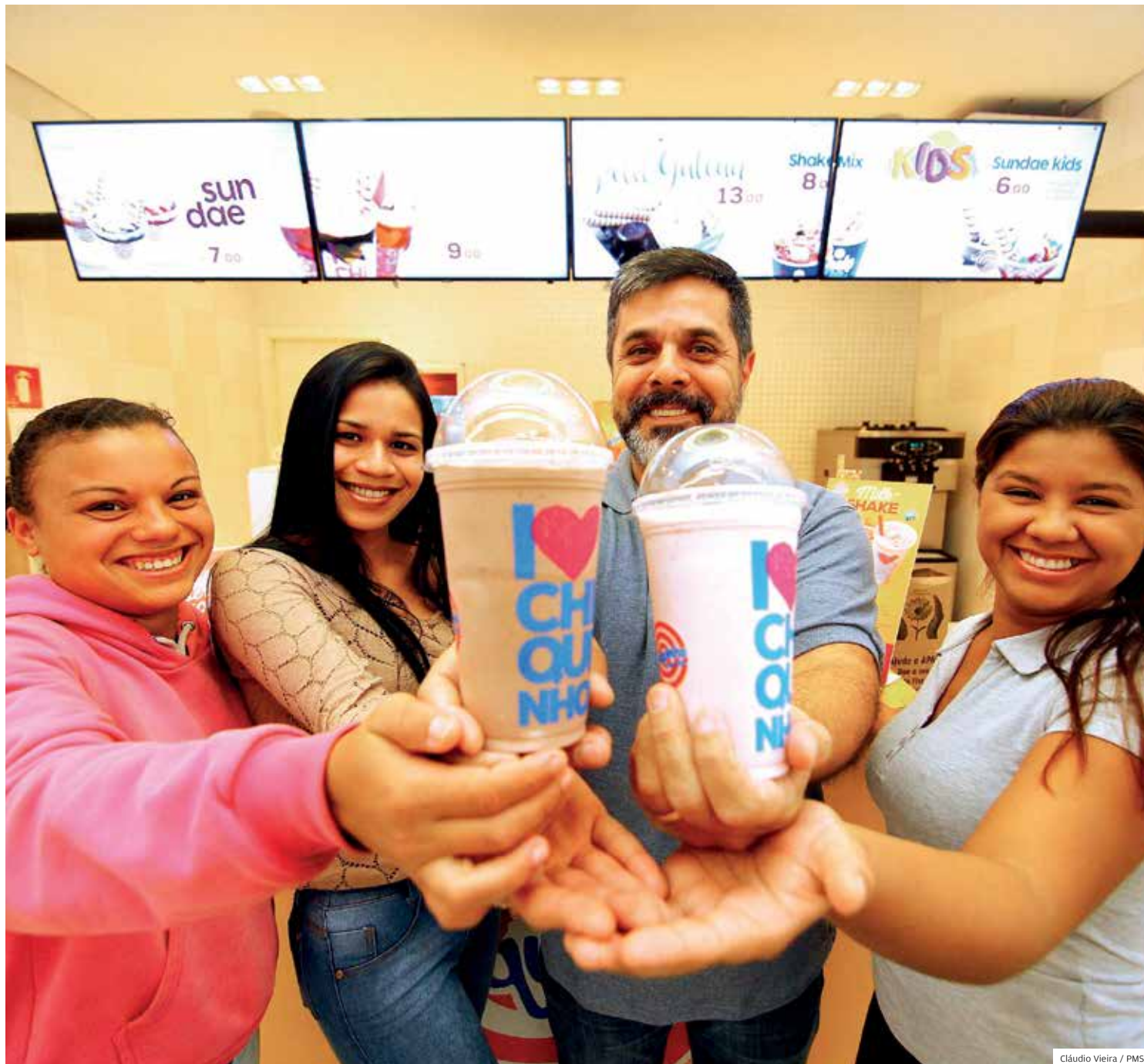
Vida mais doce. Rede de sorveteria contratou funcionárias durante a Feira do Empreendedorismo e Trabalho, ocorrida em agosto