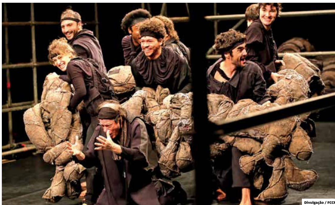
Especial. Grande Sertão: Veredas abriu 34º Festivale em 28 de agosto: público lotou Teatro Municipal

Para as mesas não é necessário fazer inscrição, já os interessados em participar das oficinas devem se inscrever pelo aplicativo São José Viva,