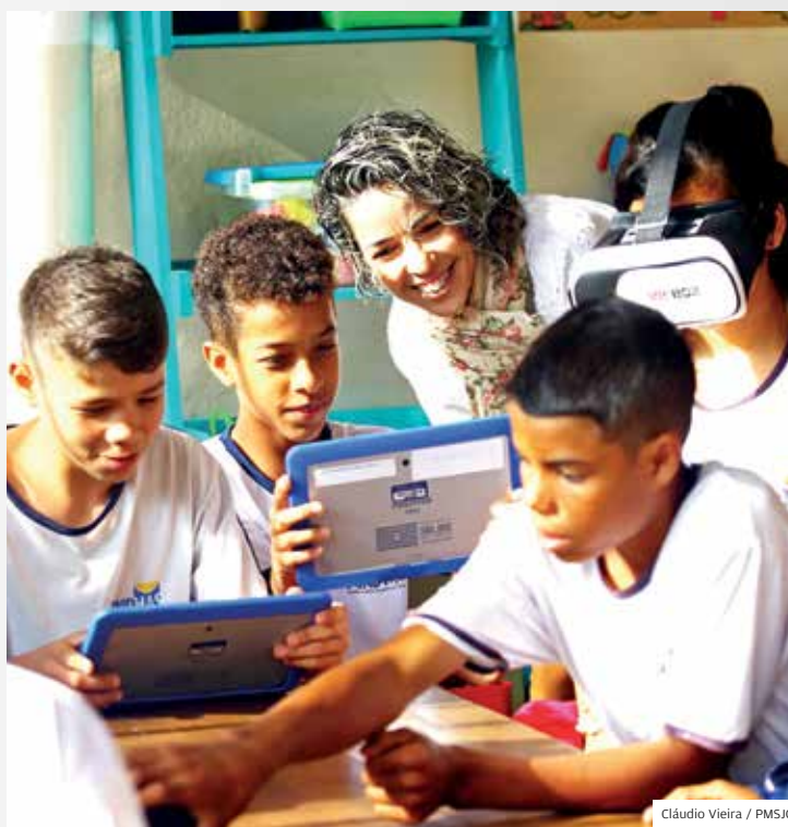
Avanço. Óculos de realidade virtual e tablets são utilizados em sala