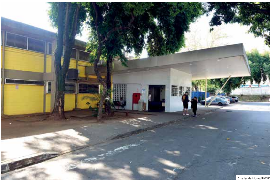
Atendimento. Médico atende em Unidade de Especialidades