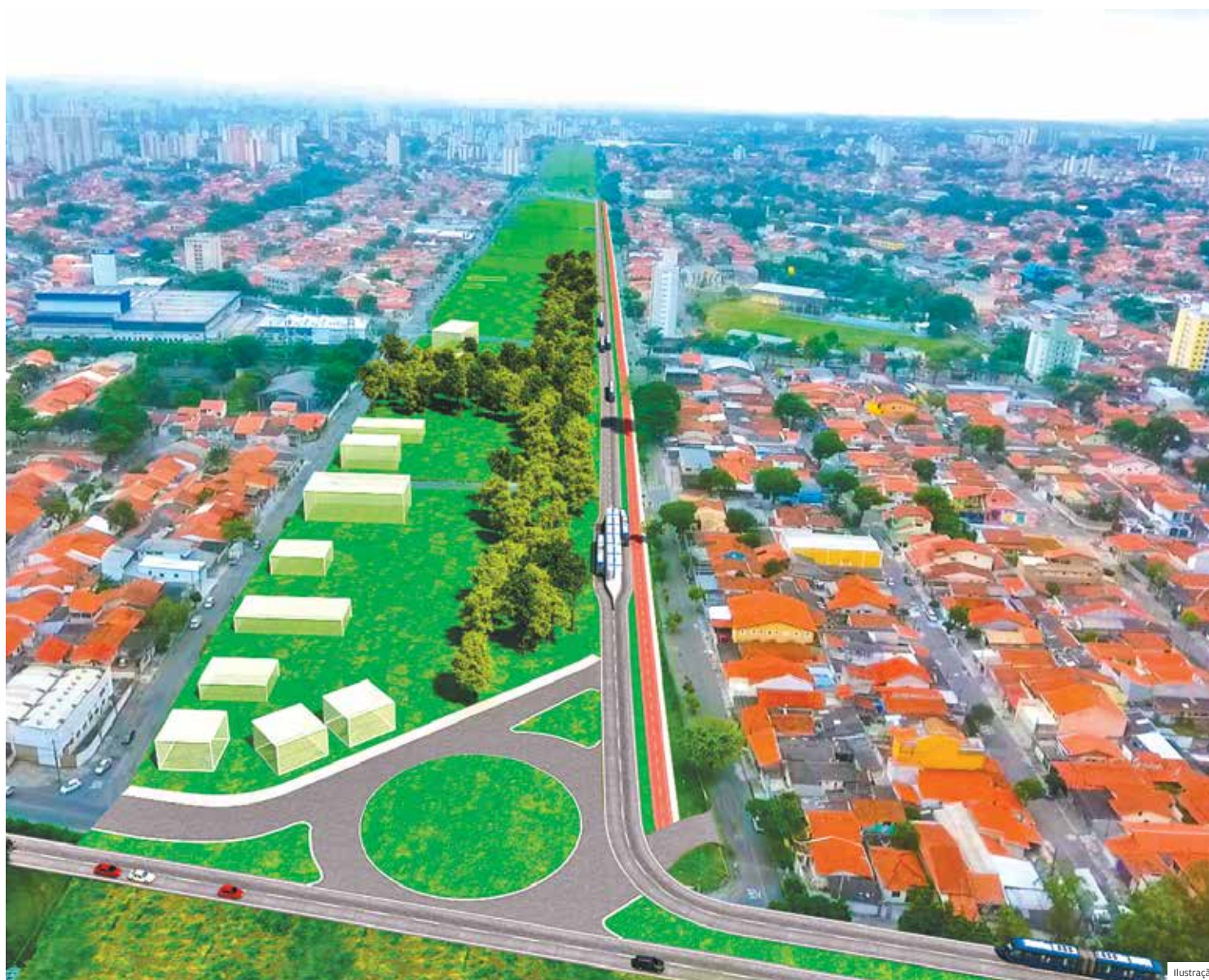
Sem divisão. Torres hoje dividem a cidade de ponta a ponta