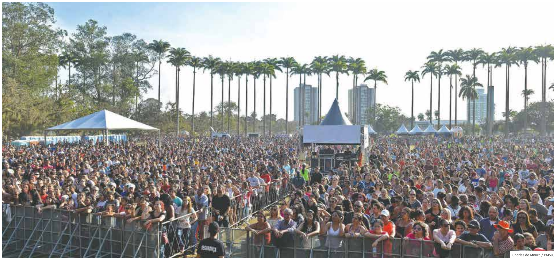
Charles de Moura / PMSJC

ESPECIAL AGENDA COMPLETA DE EVENTOS PODE SER CONFERIDA NO SITE DA PREFEITURA DE SÃO JOSÉ