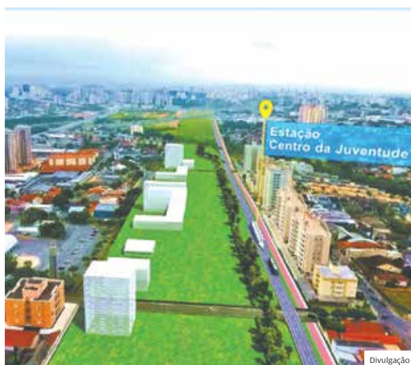
Região sul. Linha Verde vai integrar bairros populosos