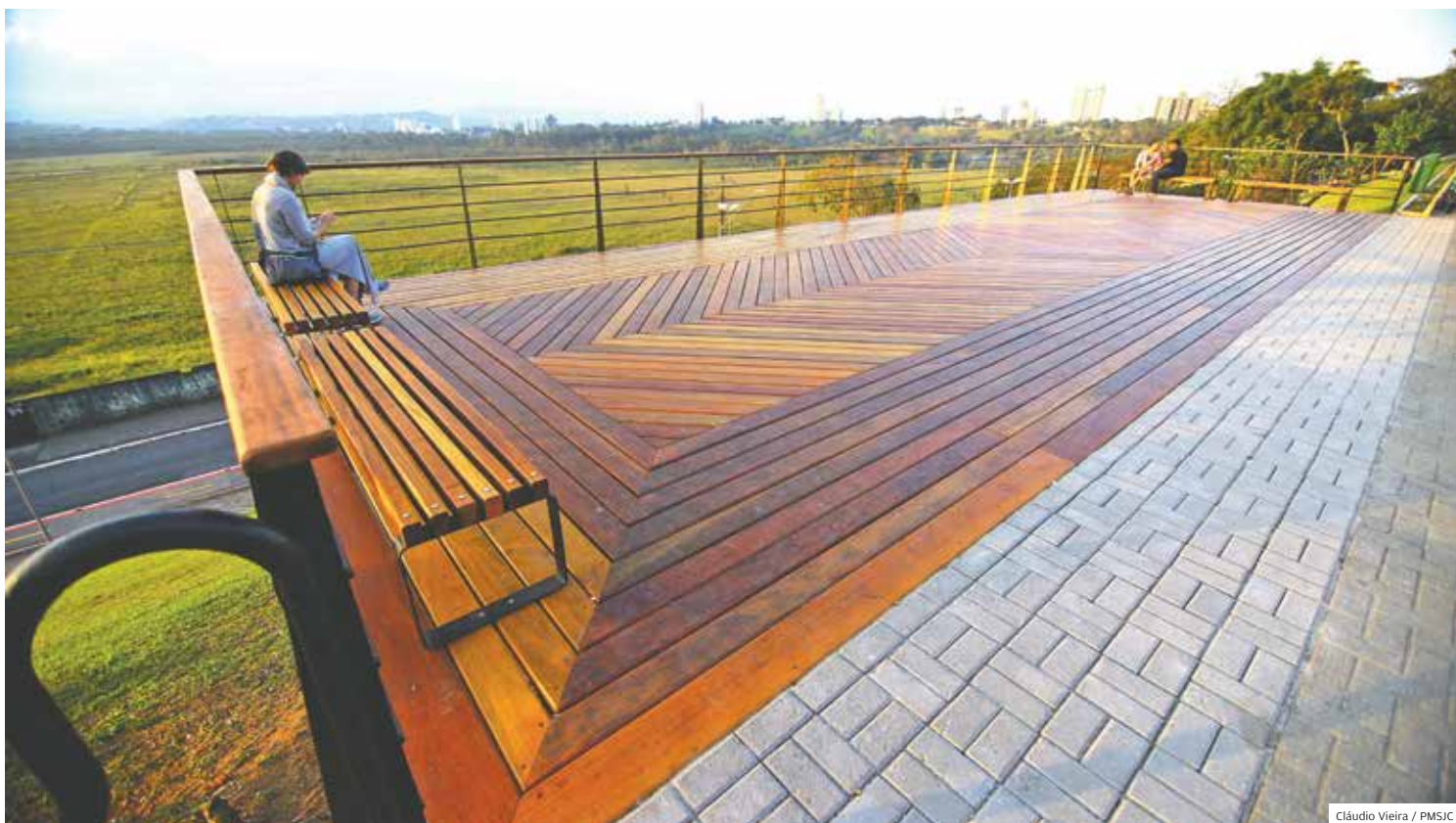
Beleza. Um dos principais pontos de contemplação do Banhado e cenário de 'selfies', mirante da avenida Anchieta foi revitalizado

Audiências públicas Para debater o projeto da nova Lei de Zoneamento acontecem em todas as regiões da cidade