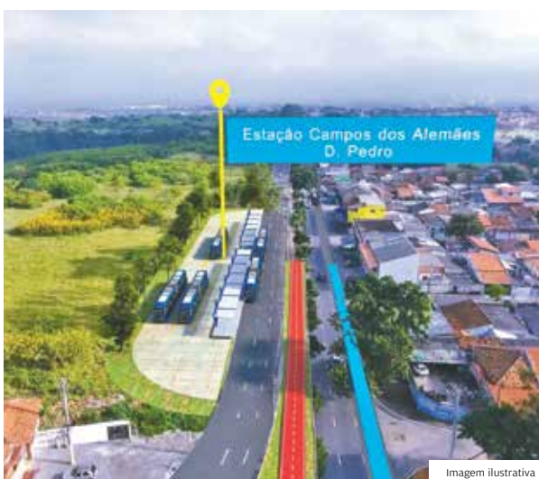
Início. Estação de transbordo é o ponto de partida