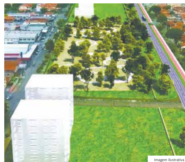
Verde. Trajeto da Linha Verde terá quatro praças