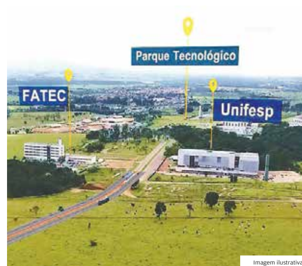
Região leste. Projeto terá a maior ciclovia da cidade