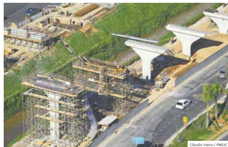
Avante. Arco da Inovação, na região oeste, segue a todo vapor

Na Arena, os serviços são executados pela empresa Porto Belo Engenharia e Comércio e custarão R$ 41,845 milhões, com previsão de entrega em 18 meses. A construção da Rotatória do Gás, na região leste da cidade também segue a todo vapor para melhorar a vida das pessoas.