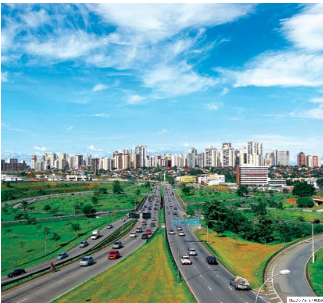
Setores. Crescimento da indústria e do setor de serviços puxaram a retomada da economia de S. José

“Óleo e gás, além do ramo automotivo, apresentaram