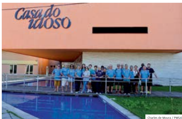
Atividades. Idosos em frente à Casa do Idoso, em São José

capacitada para o desenvolvimento das atividades aos idosos e também aos seus familiares. Hoje, as quatro Casas da cidade atendem, mensalmente, cerca de 6.000 idosos. Centro de referência para os idosos, as unidades oferecem atividades gratuitas nas áreas da assistência social, educação, esportes, recreação, lazer e cultura. Além disso, tem atendimento médico preventivo.