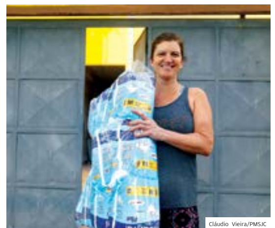
Em casa. Entrega de fralda facilita para paciente