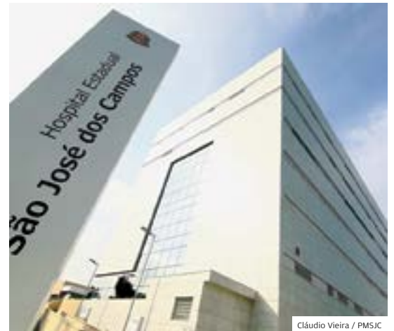
Saúde. Fachada do Hospital Regional, em S. José

uniformes divididos por área e sala de espera com televisão e internet para os pacientes da cidade: nível de satisfação está em alta