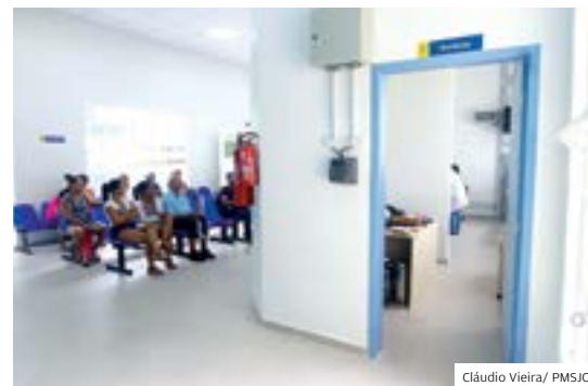
De olho. Gerente da unidade fica na recepção