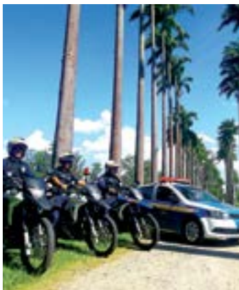
Guarda. Investimento na GCM garantiu ótimos resultados

A iniciativa da Prefeitura ainda contribuiu para a redução