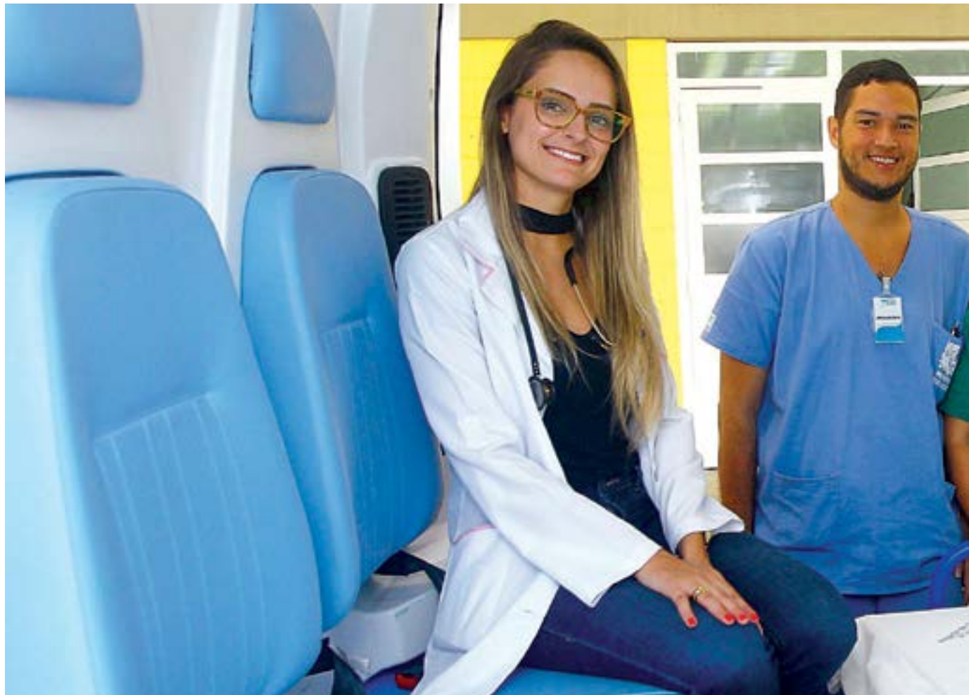
Emergência. Profissionais do Clínicas Sul na nova ambulância com UTI (Unidade de Terapia Intensiva); unidade ainda tem unif