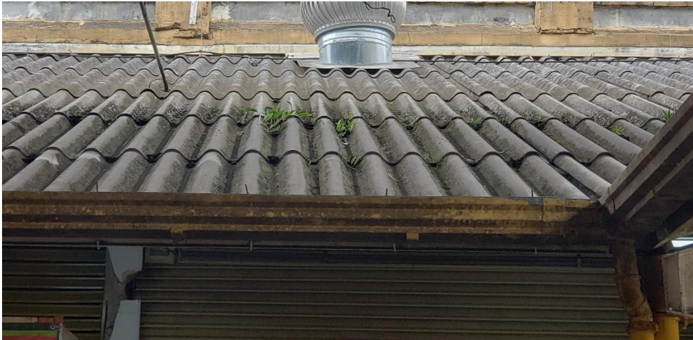
Figura 3 – telhado