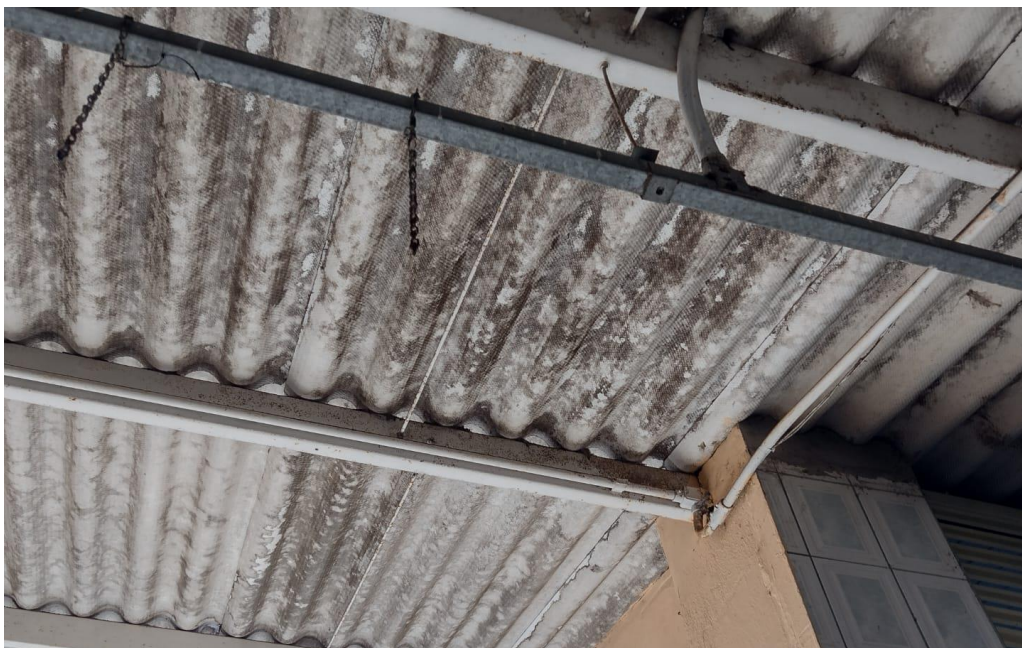
Figura 7 – telhado e instalações elétricas