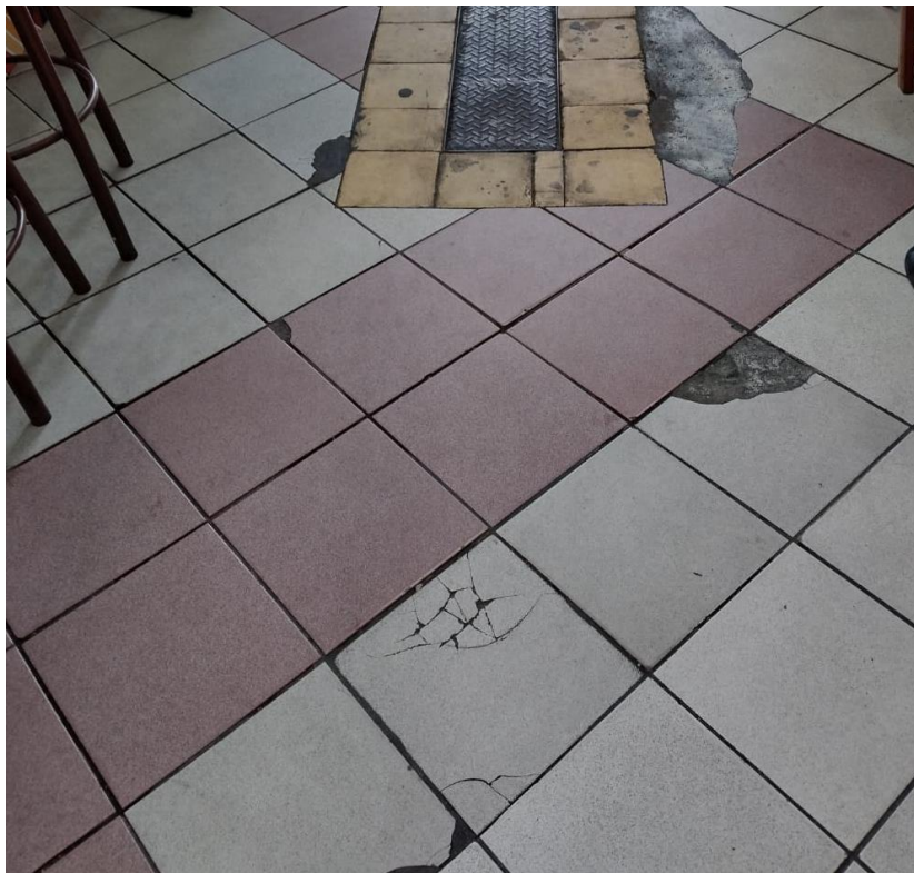
Figura 16 – piso interno