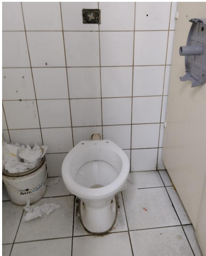
Figura 12 - banheiro masculino