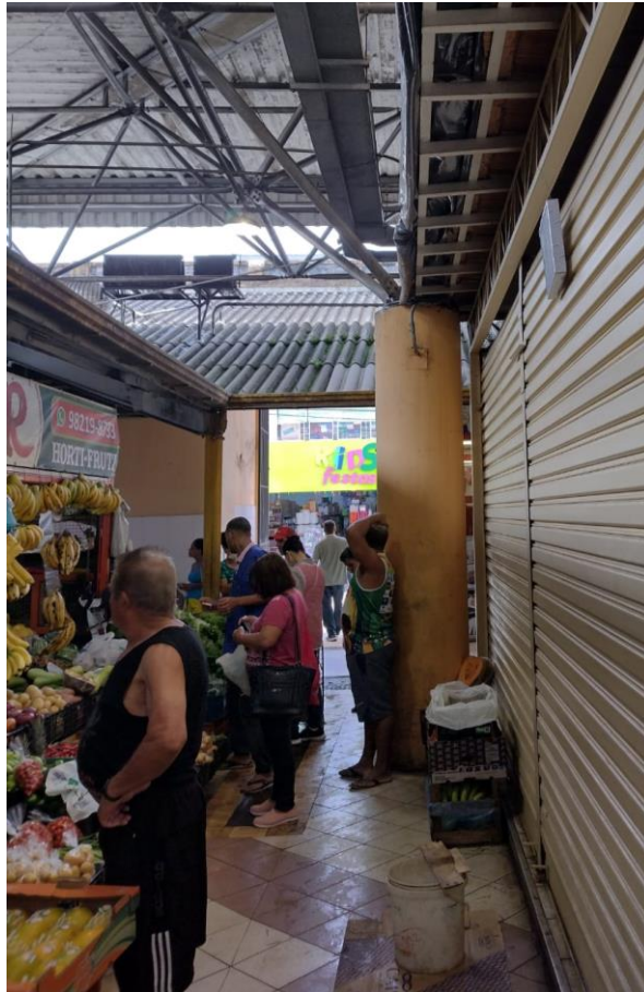
Figura 6 - telhado com goteiras