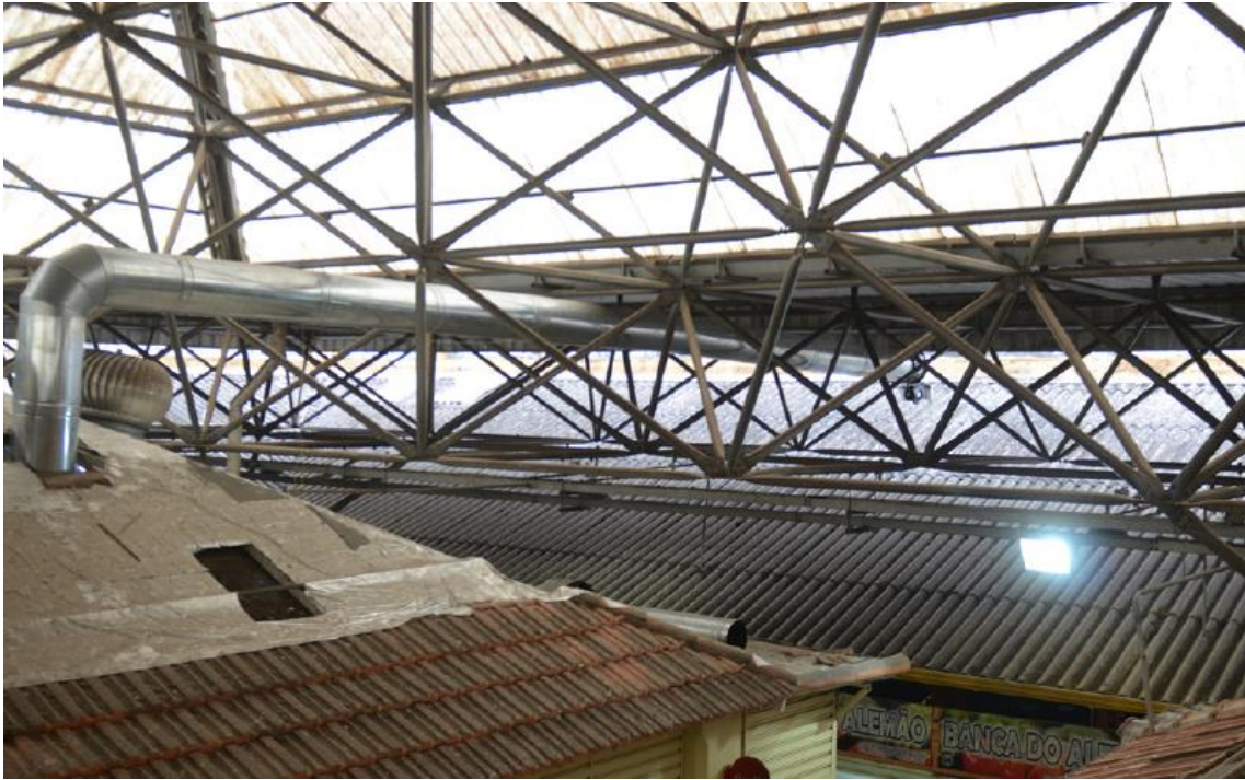
Figura 1 - estrutura e telhas