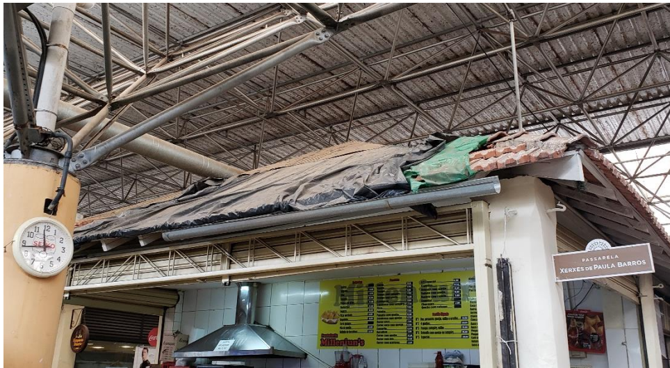
Figura 2 – telhado