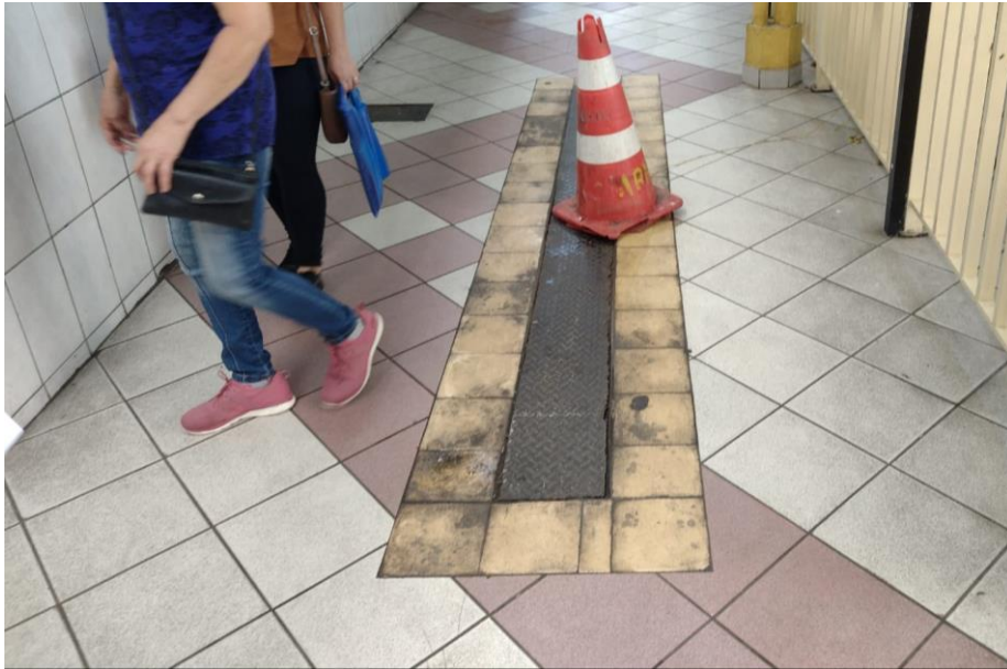
Figura 15 – grelhas de águas pluviais