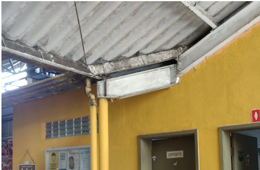
Figura 4 - telhas, rufos e calhas