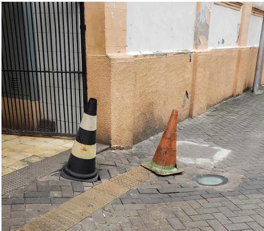
Figura 14 - piso cedendo