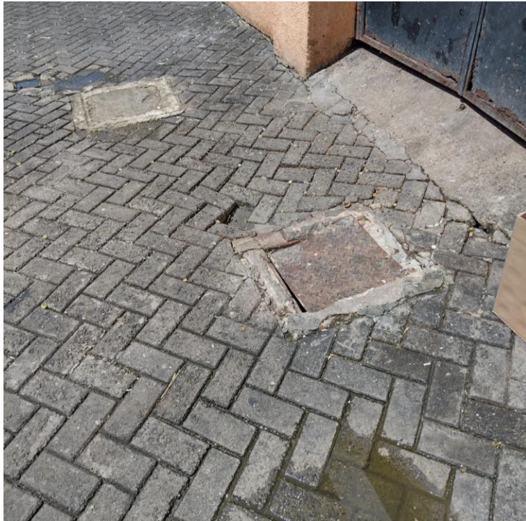
Figura 13 – tubulação e caixas de passagem