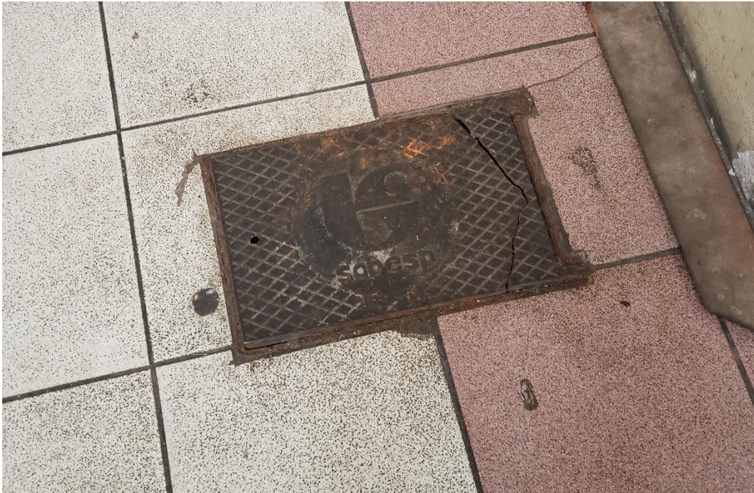
Figura 17 - caixa de inspeção