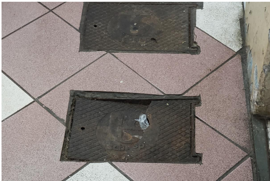
Figura 18 - caixa de inspeção