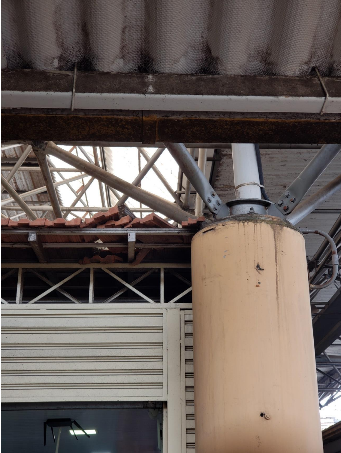
Figura 5 - telhado