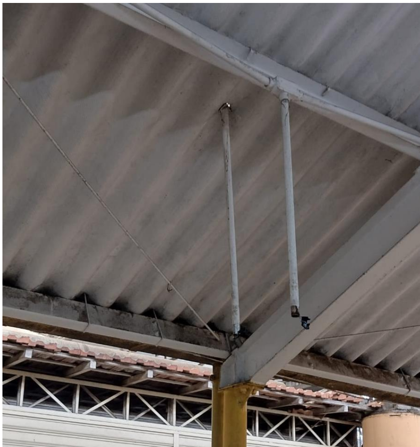
Figura 8 – instalações elétricas aparentes