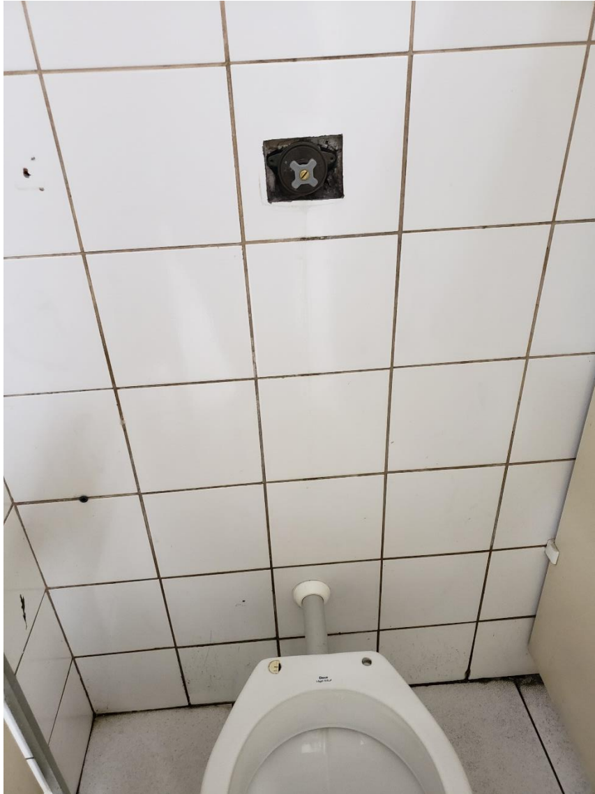
Figura 10 - banheiro feminino