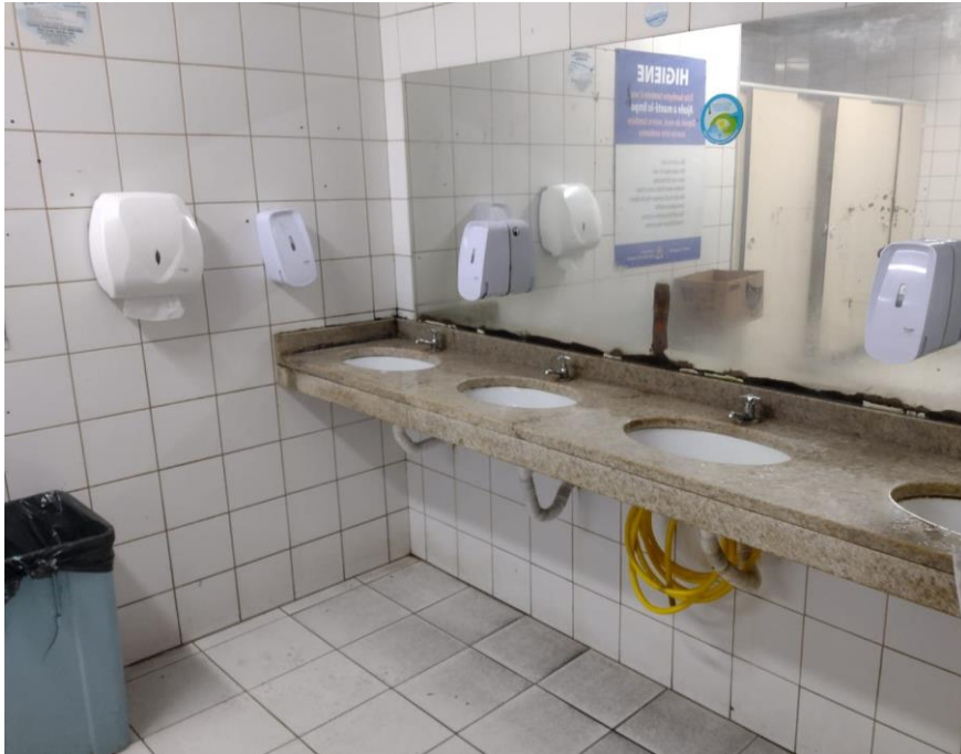
Figura 11 – banheiro masculino